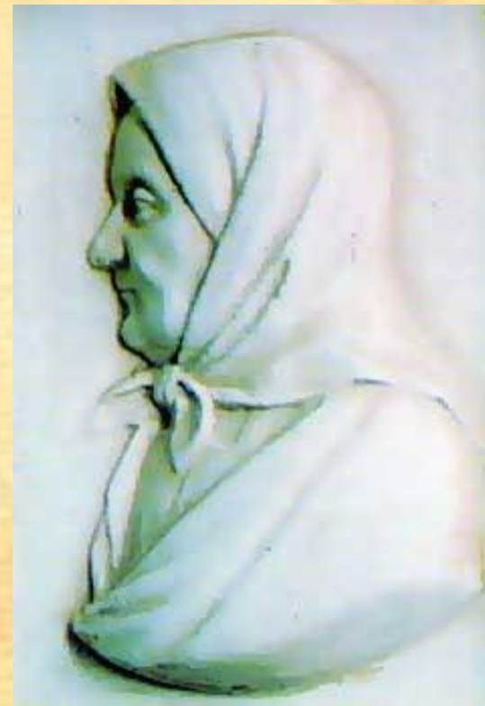
Яковлева Арина Родионовна

Любовь к родному языку маленькому Пушкину привили бабушка, Мария Алексеевна Ганнибал, превосходно говорившая и писавшая по-русски, и няня Арина Родионовна.