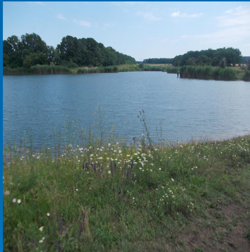
Большой козиный став