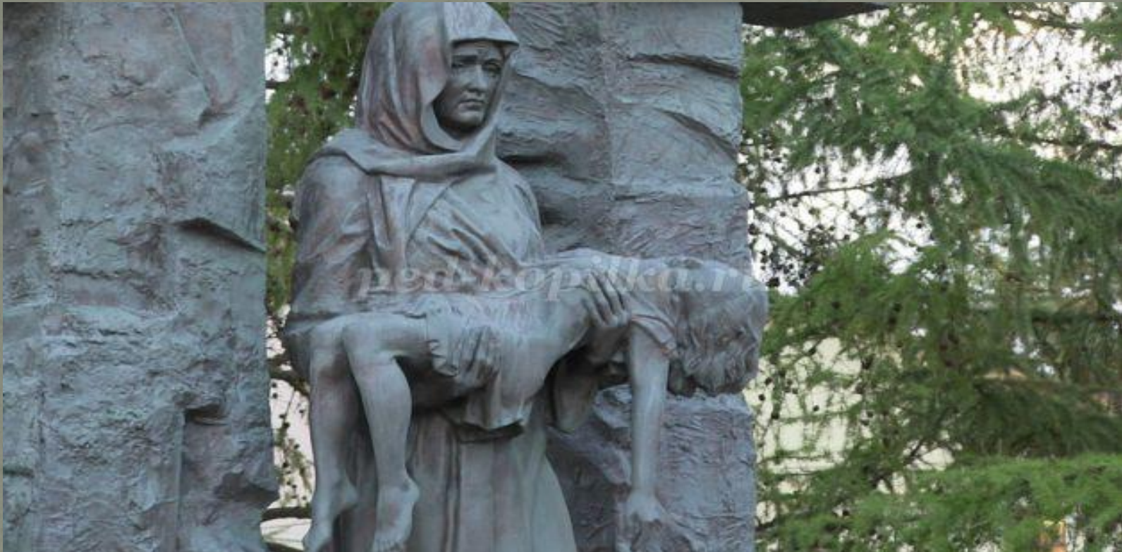
Памятник «Скорбящая мать Беслана»