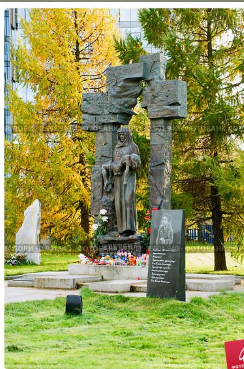
Памятник Детям Беслана у Храма Успения Богородицы. Санкт-Петербург.

в Санкт-Петербурге. В основание заложены капсулы с землёй, привезённой из Северной Осетии, с мемориального кладбища на территории школы № 1. Монумент установлен в сквере Храма Успения Пресвятой Богородицы