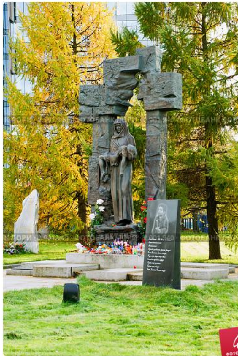
Памятник Детям Беслана у Храма Успения Богородицы. Санкт-Петербург.

в Санкт-Петербурге. В основание заложены капсулы с землёй, привезённой из Северной Осетии, с мемориального кладбища на территории школы № 1. Монумент установлен в сквере Храма Успения Пресвятой Богородицы