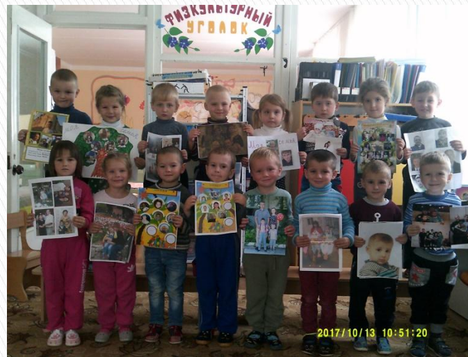
«Я и моя семья»