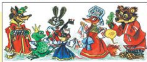
Русские народные сказки.