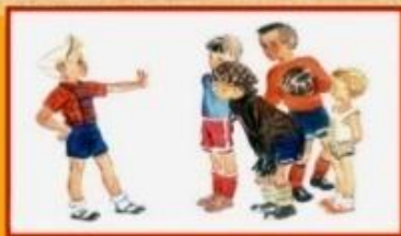
Рассказы о детях и для детей