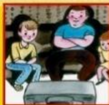
Видеофильмы, кинофильмы, аудиозаписи