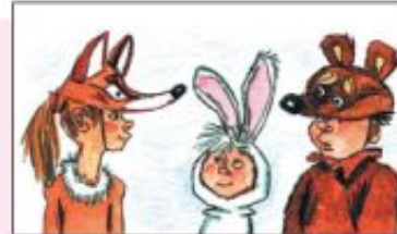
Костюмы для персонажей сказок.