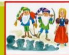
Инсценировки литературных произведений