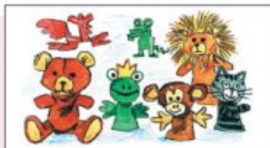
Герои сказок в рисунке, лепке...