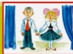
Конкурсы: «Кто лучше сочиняет», «Кто лучше исполняет»