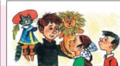
Спектакль, викторина, собственные рассказы о животных.