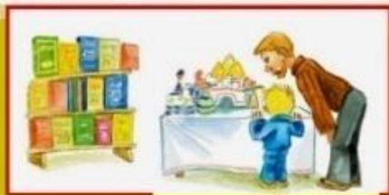
Выставки книг и поделок по разным темам