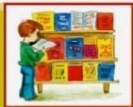
Викторина «Кто больше знает»