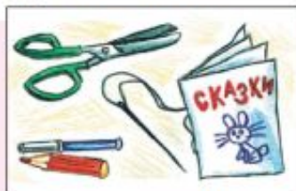
Сборник сказок об одном животном (зайце, лисе, медведе...)