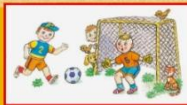
Стихотворения о детях и для детей