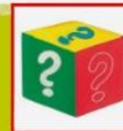
Придумай свой проект