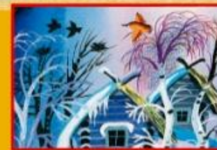
Произведения о весне