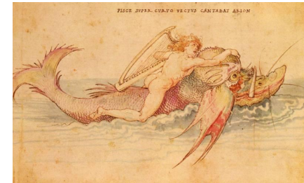
Легенда об Арионе

1) поэтическое предание о каком-нибудь историческом событии;