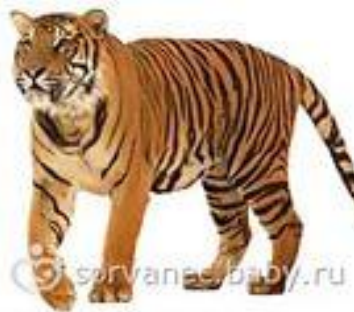
С тигром - котик