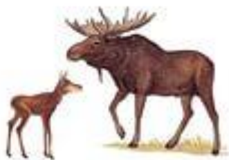
У лося - олень