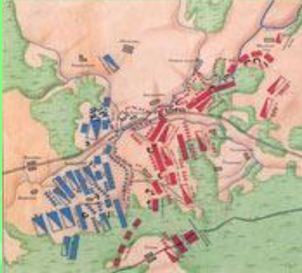
План Бородинского сражения