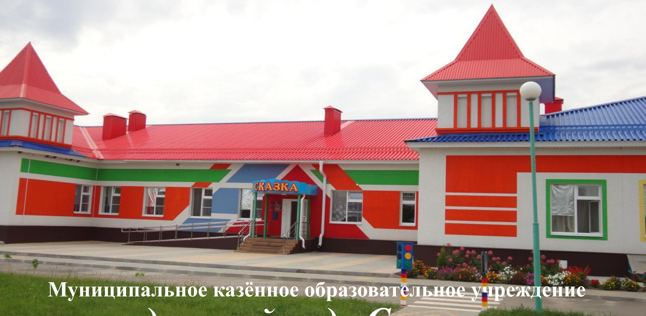
Муниципальное казённое образовательное учреждение детский сад «Сказка» (г. Острогожск)