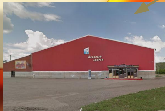
Ледовый дворец спорта