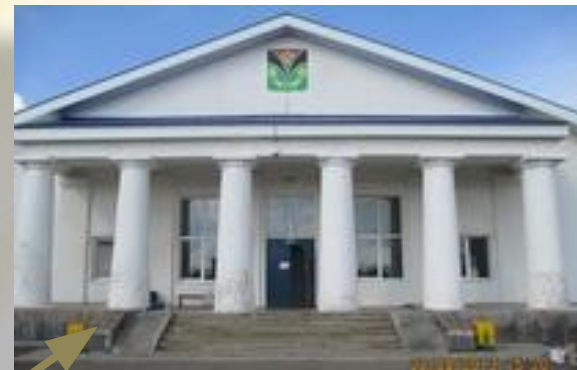
ДЮСШ «Нефтяник» по хоккею с шайбой