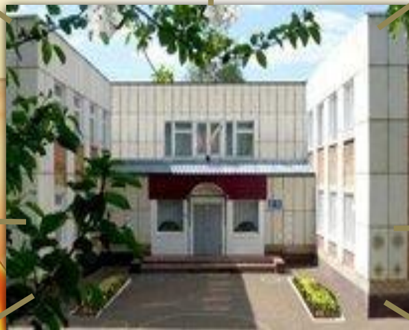
МБДОУ «Детский сад № 32»