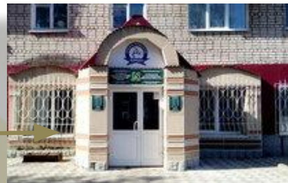
Спортивная школа по борьбе