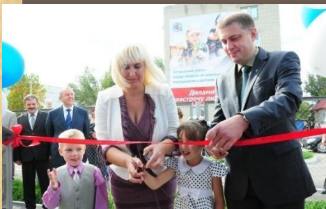
Подарок Ростелекома Петровчанам