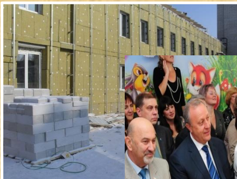
Так все начин