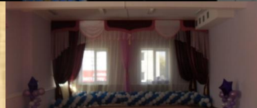
В зале песни малыши теперь поют