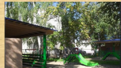
Прокатиться с горки, поиграть можно на участке