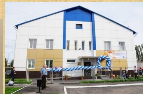
Детский сад ждет ребят