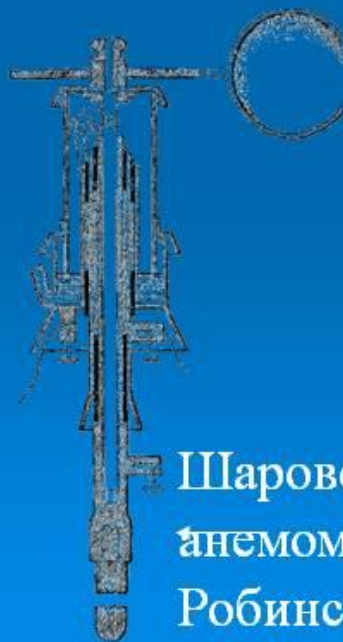
Шаровой анемометр Робинсона