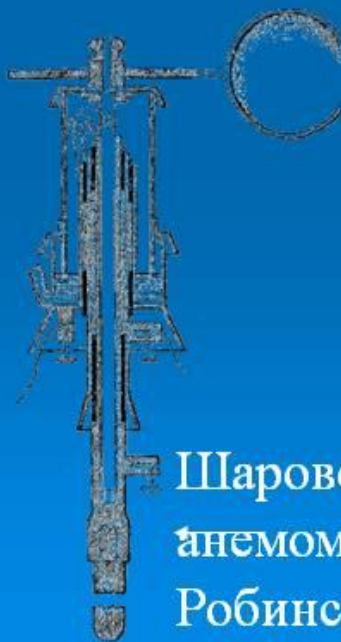
Шаровой анемометр Робинсона