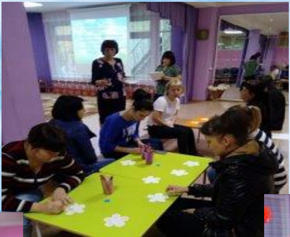
Игра: «Цветы желаний»