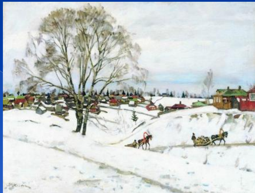
Зима. Сергиев посад.