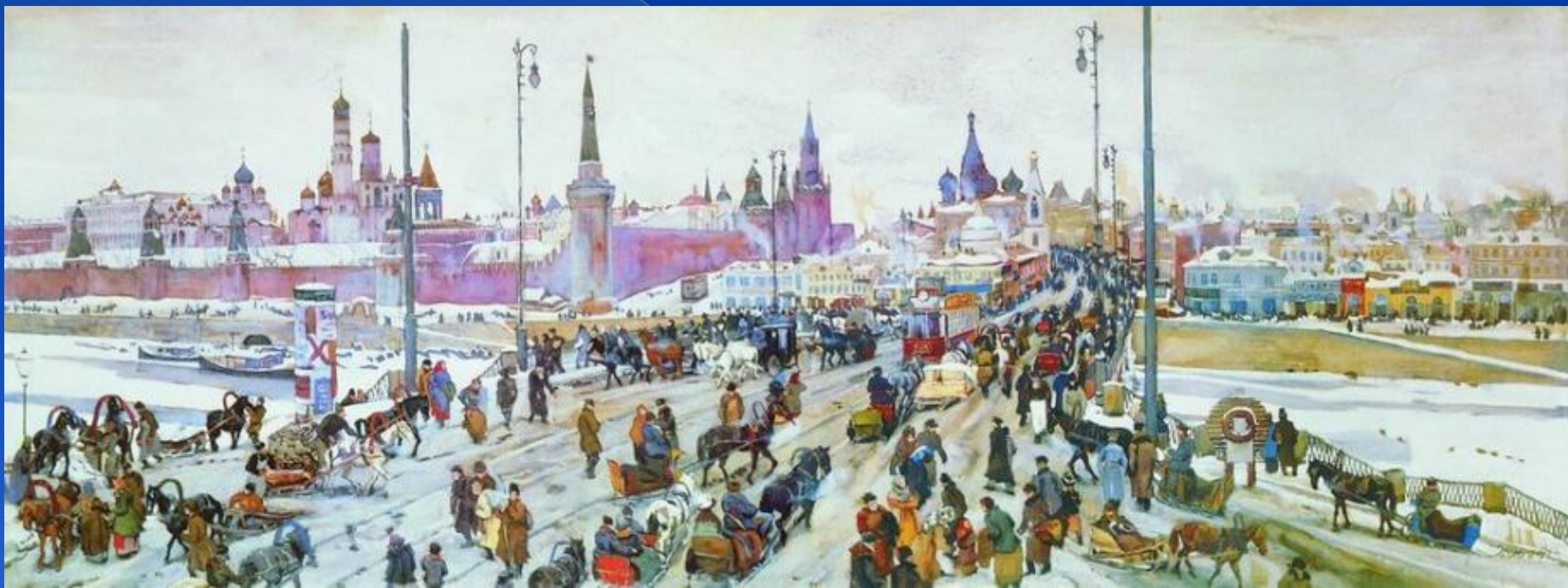
Москва. Москворецкий мост.

Учился К.Ф. Юон в Московском училище живописи, ваяния и зодчества. Среди его преподавателей был замечательный русский художник В.А. Серов. Много картин Юон посвятил Москве, её сказочному Кремлю.