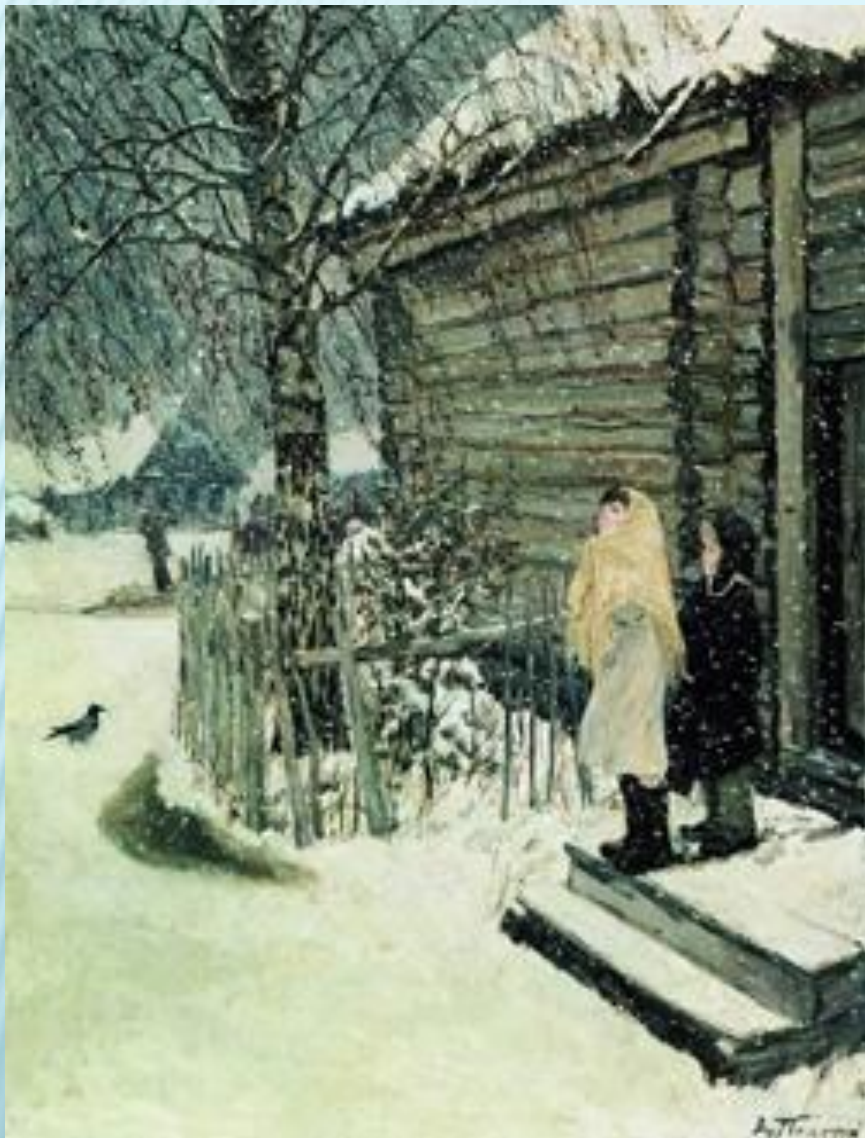
НИКОЛАЙ КРЫМОВ. ЗИМУШКА-ЗИМА.