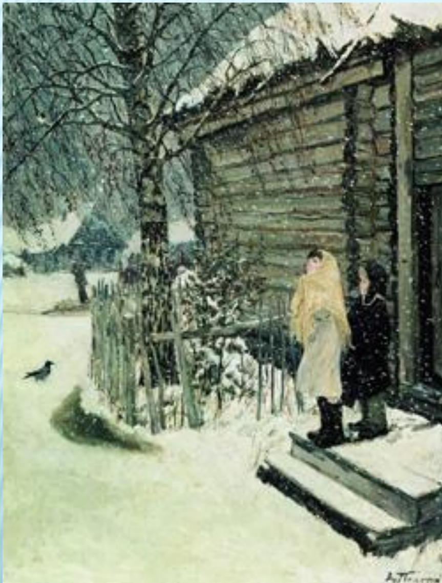
АРКАДИЙ ПЛАСТОВ. ПЕРВЫЙ СНЕГ.