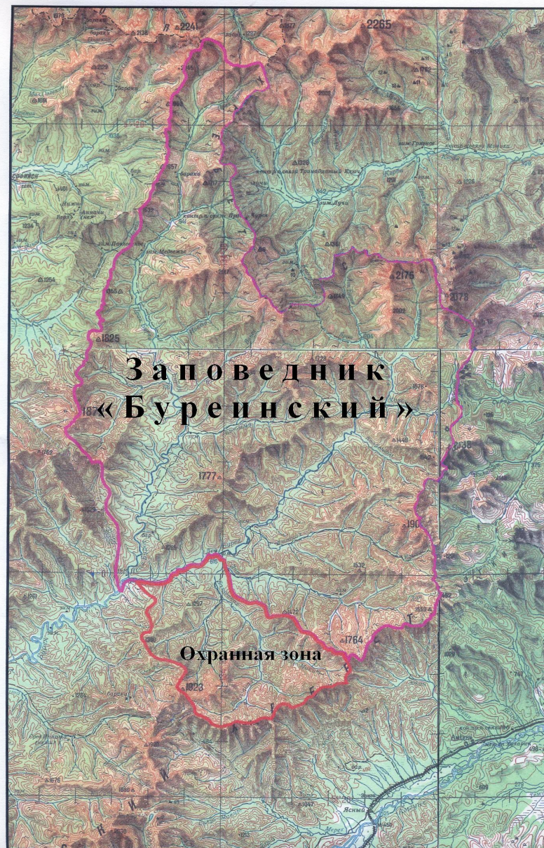
ТЕРРИТОРИЯ ГОСУДАРСТВЕННОГО ПРИРОДНОГО ЗАПОВЕДНИКА "БУРЕЙНСКИЙ"

Целью его создания явилось сохранение в нетронutom виде уникального участка восточносибирской тайги охотского типа. Уникальность этого красивейшего уголка природы Дальнего Востока России заключается в том, что он не затронут хозяйственной деятельностью человека. Его естественные ландшафты, животный и растительный мир сохранились в первозданном виде. Их охрана и изучение являются важнейшими функциями заповедника.