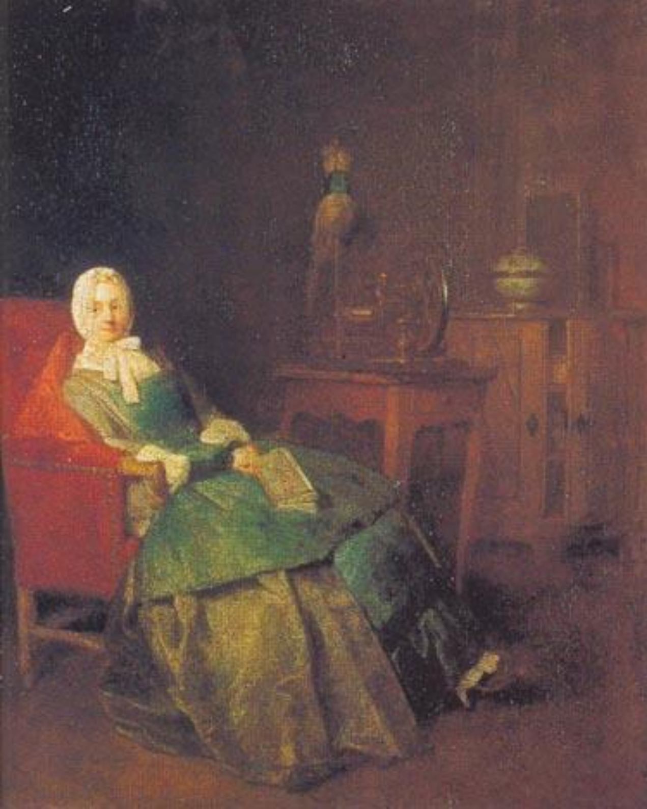
Жан Батист Симеон Шарден «Домашние радости»