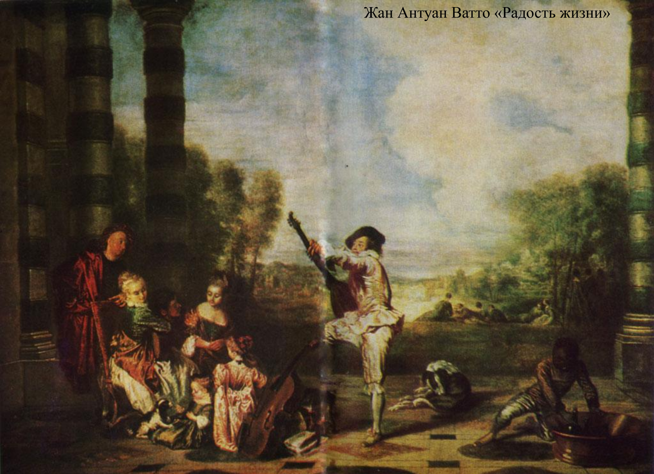
Жан Антуан Ватто «Радость жизни»