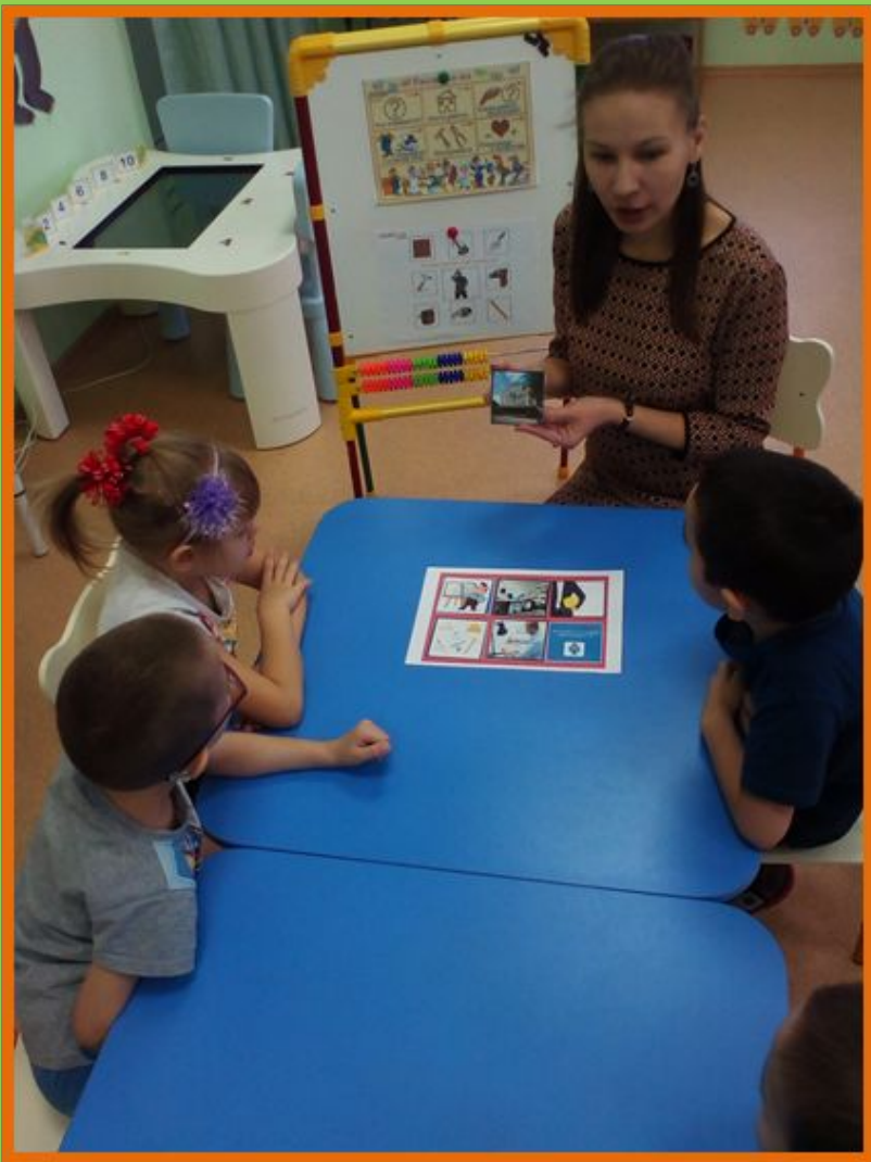
Беседа о профессии строителя