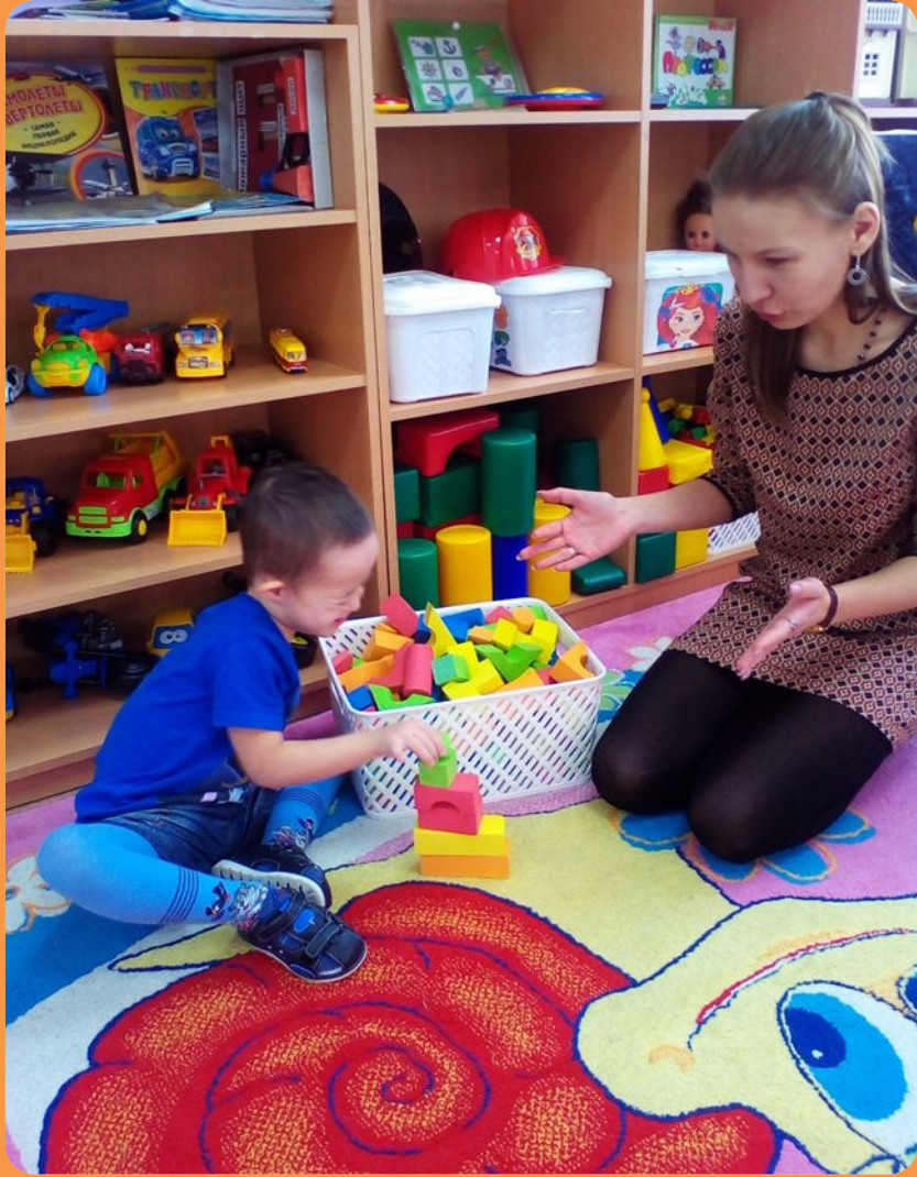
Обучение конструированию башни детей-инвалидов