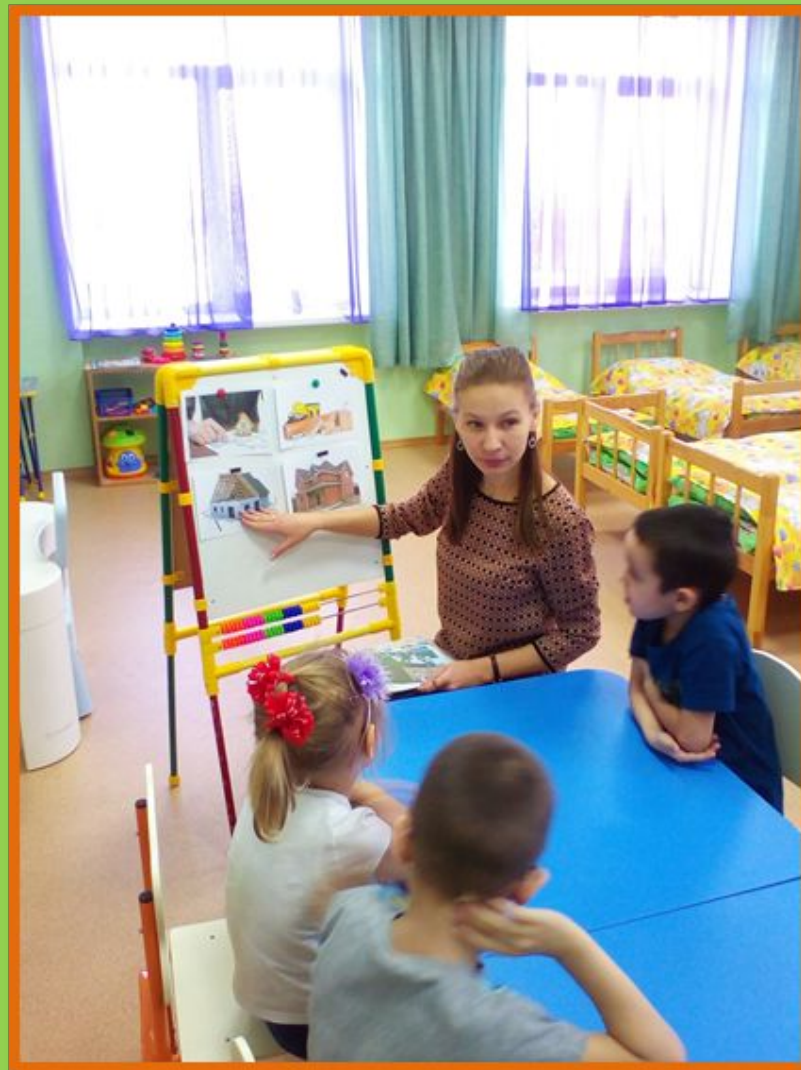
Обсуждение этапов строительства