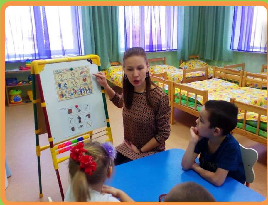
Составление описательного рассказа о профессии строителя по мнемотаблице