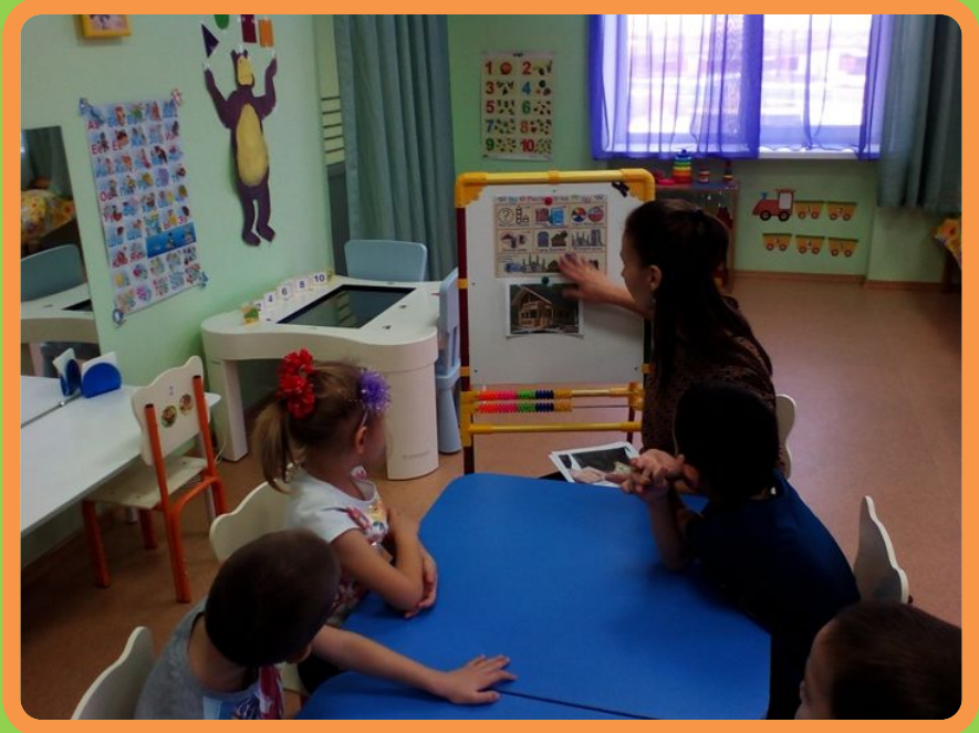
Составление описательного рассказа о домах по мнемотаблице