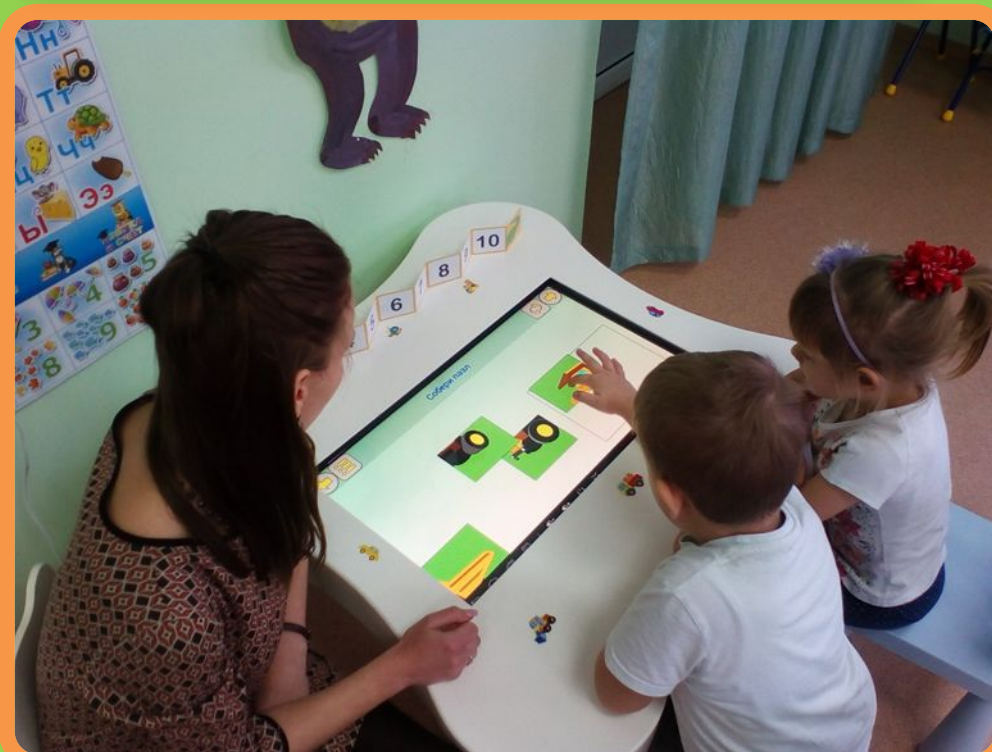
Познавательные игры на интерактивном столе