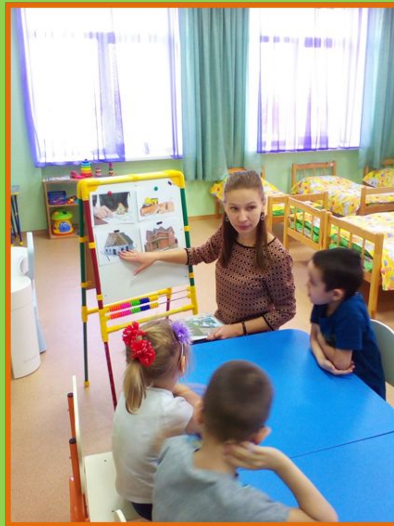
Обсуждение этапов строительства