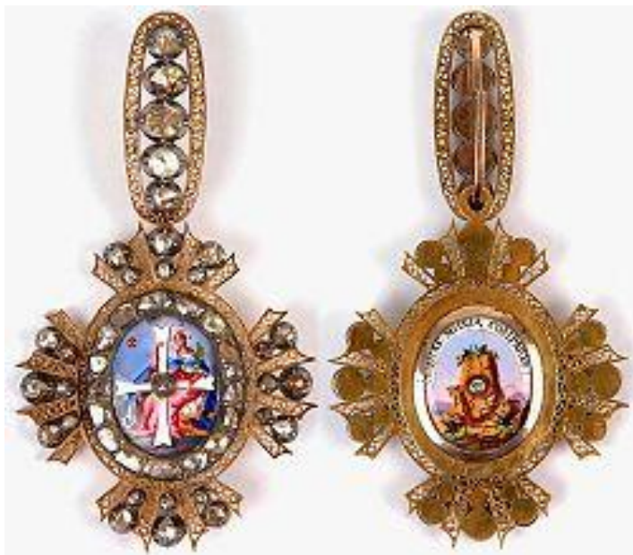
Орден Святой Екатерины Российская империя