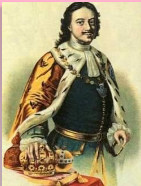
Петр I Великий