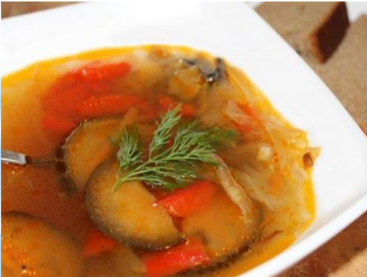
Куриная похлебка с помидорами и грибами