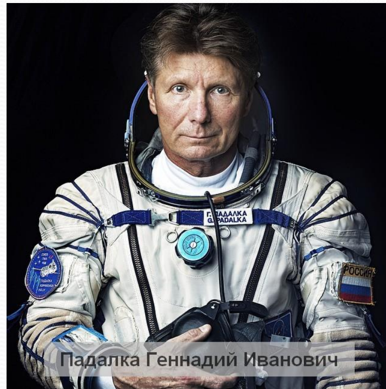
Падалка Геннадий Иванович