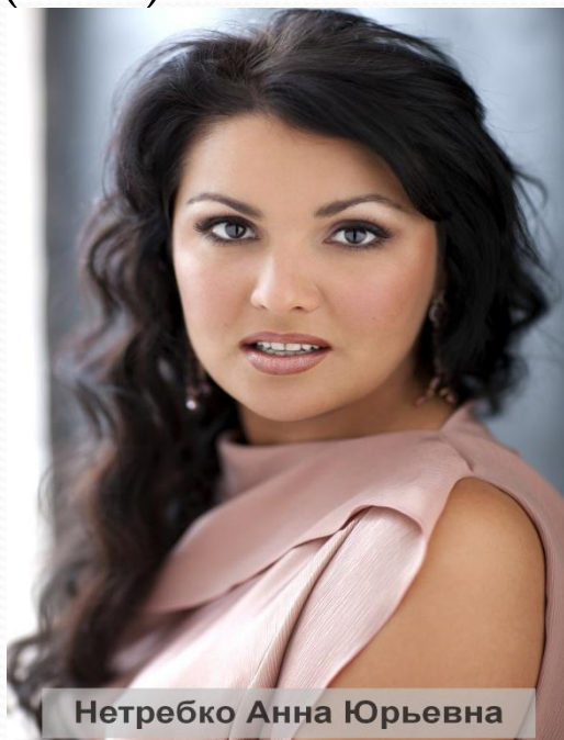
Нетребко Анна Юрьевна