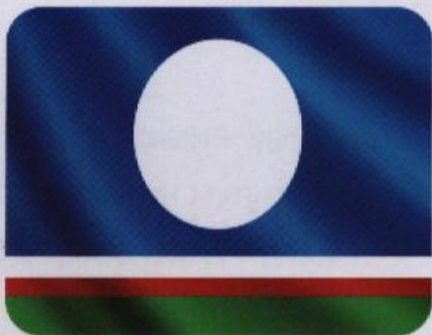
Флаг Республики Саха (Якутия) Саха Республикатын былааба

Голубой – символ мирного неба, надежды, свободы, белая полоска – суровую красоту северного края, зеленая – короткое яркое лето, дружбу и братство, красный – символ силы, храбрости, чести