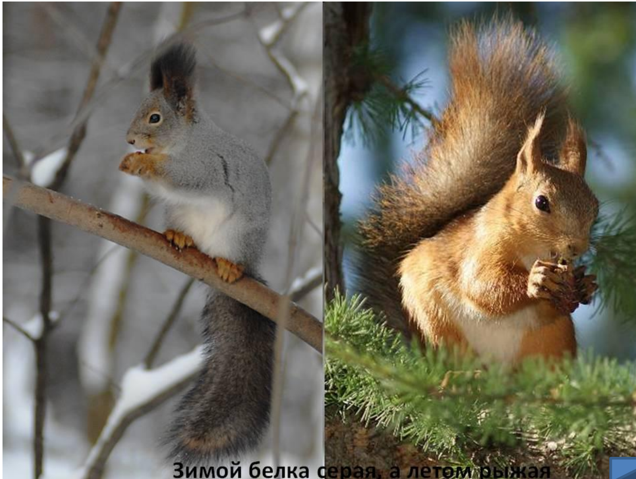
Зимой белка серая, а летом рыжая

Белка на зиму сменяет рыжий мех на серебристо-серый, который менее заметный на фоне снежного покрова. Белки не подвержены зимней спячке, но боятся холода и прячутся в дуплах. В сильные морозы белки не выходят из дупла по несколько дней и лежат в полудремном состоянии, свернувшись в клубок, укрывшись пушистым хвостом. Всю зиму белки кормятся маслянистыми кедровыми орехами, семенами лиственницы, ели или сосны.