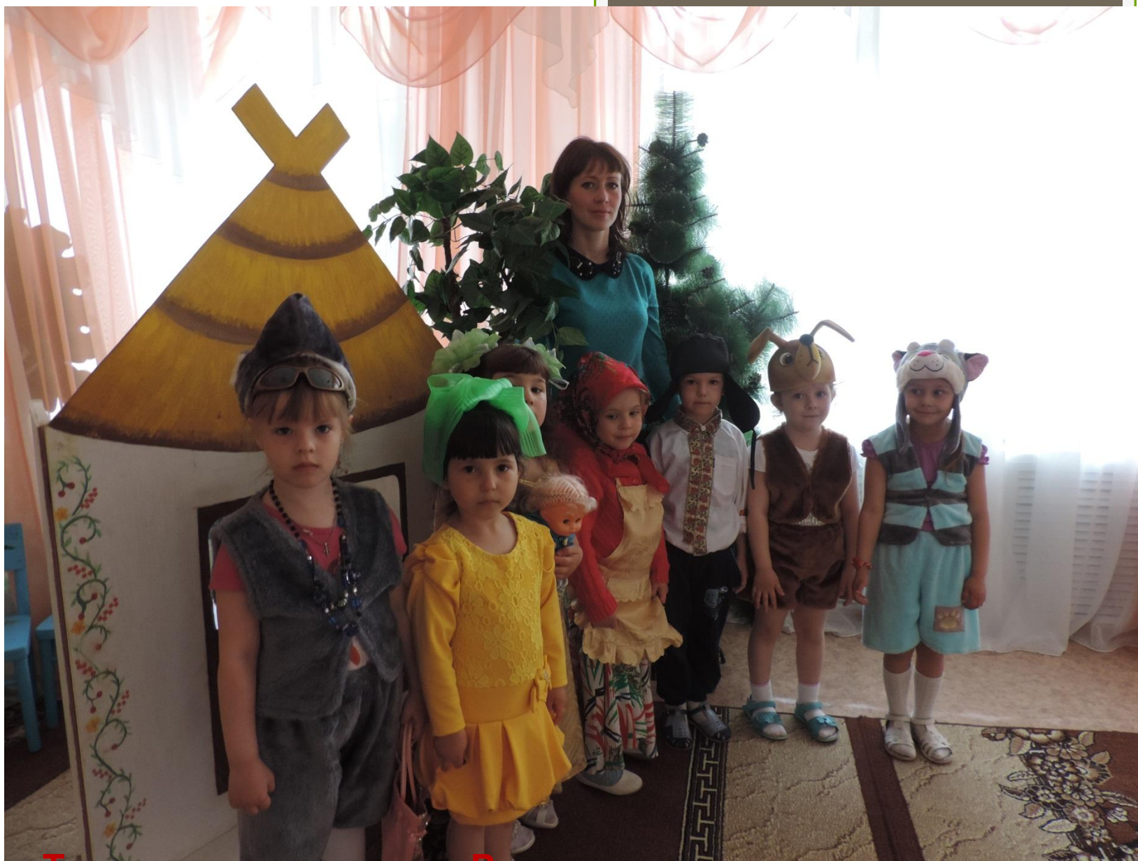
Театрализация сказки «Репка» на новый лад