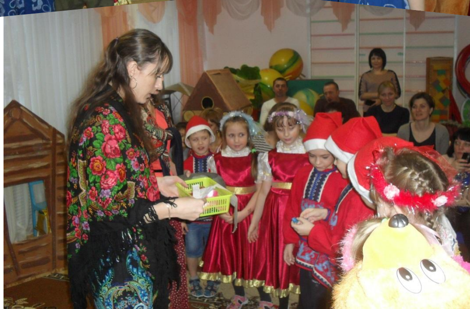
Совместное творчество детей и