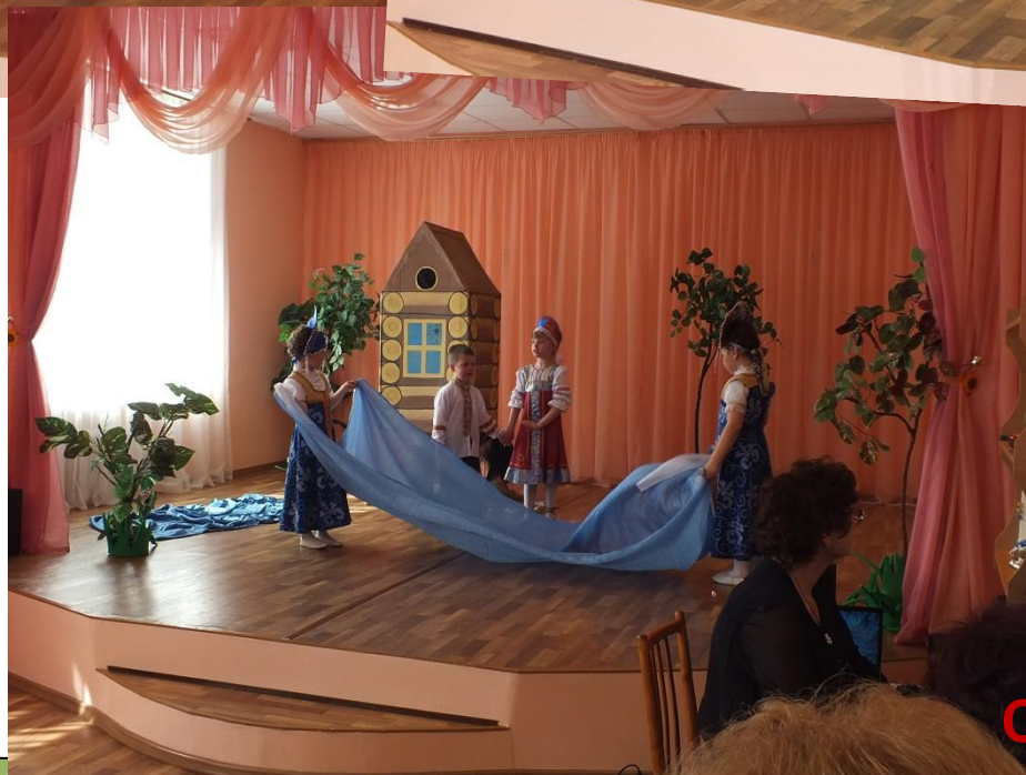
Сказка «Гуси лебеди»