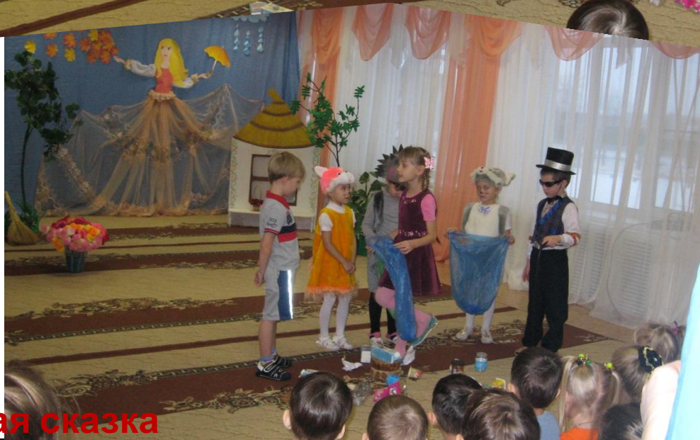
Экологическая сказка «Друзья леса»