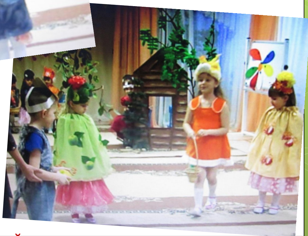
Театрализация «Заботливый Ёжик»