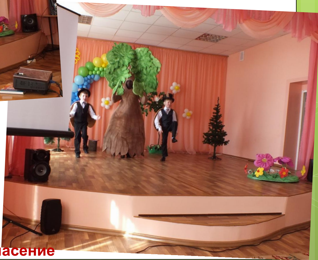
Экологическая сказка «Спасение старого Дуба»