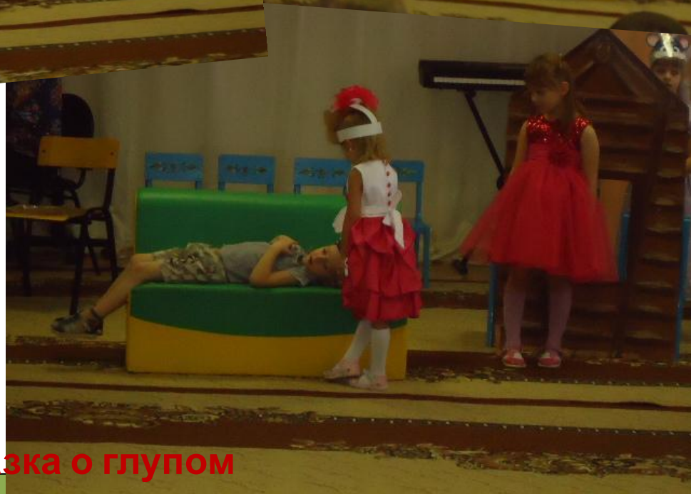
Драматизация «Сказка о глупом мышонке»