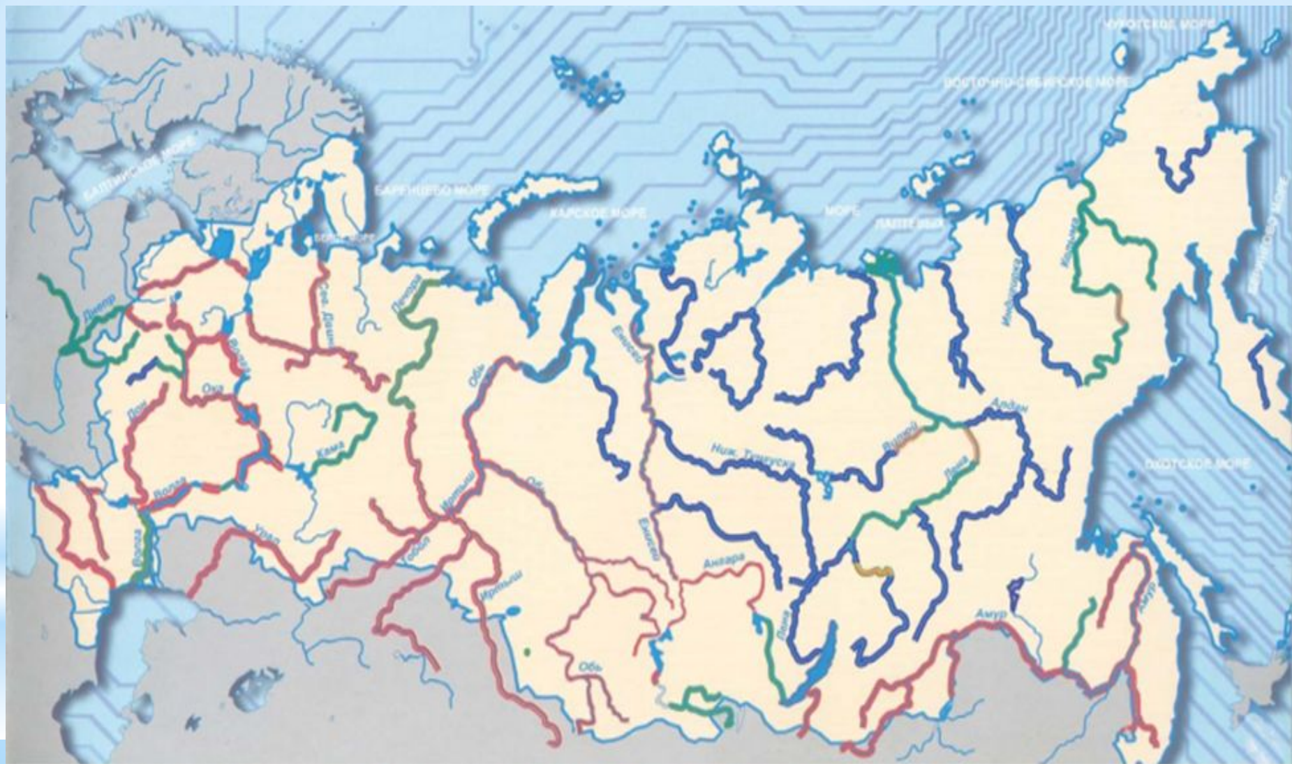
■ Условно чистая и слабо загрязненная ■ Загрязненная ■ Грязная и экстремально грязная