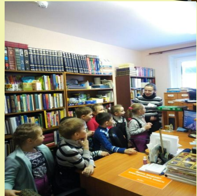
Экскурсия в библиотеку