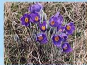
Прострел раскрытый, или сон-трава