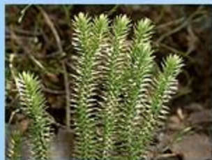
Баранец обыкновенный, или Плаун баранец