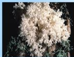
Ежевик коралловидный или гериций