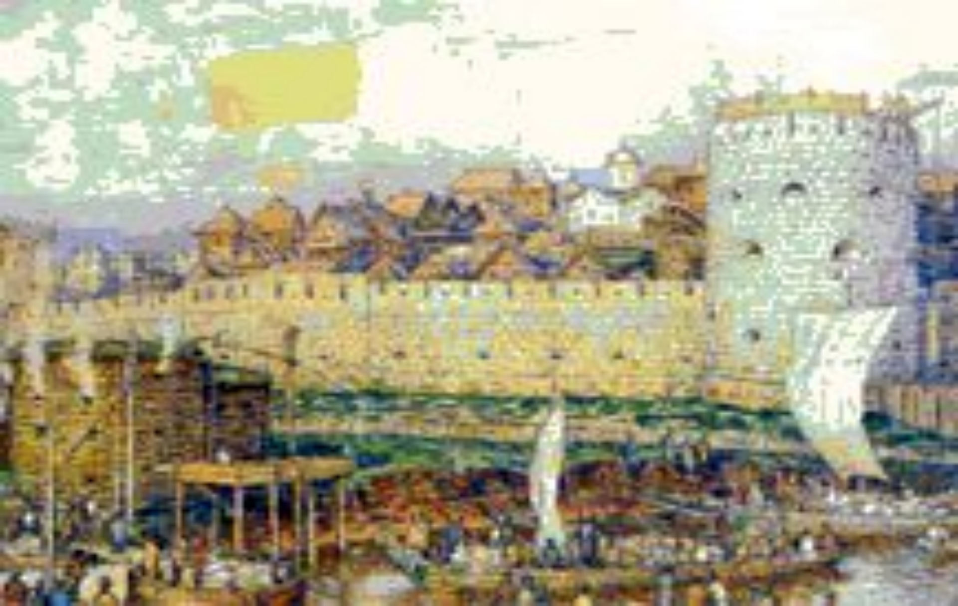
Московский Кремль при князе Дмитрии Ивановиче.