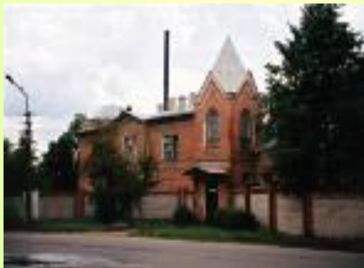
Церковь Петра и Февронии