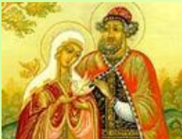
Петр и Феврония