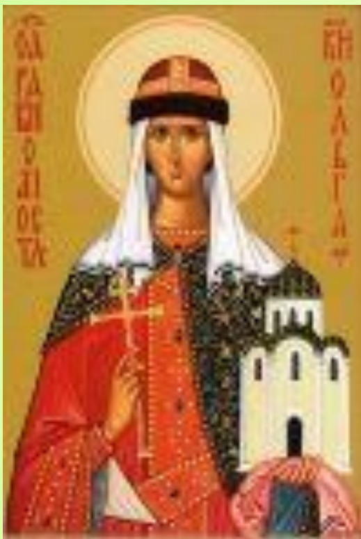
Часовня Княгини Ольги