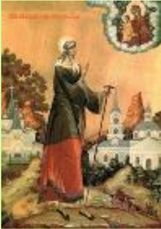
Храм-часовня Ксении Петербургской