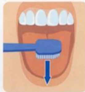
6. Чистка языка