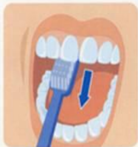
3. Внутренние поверхности передних зубов