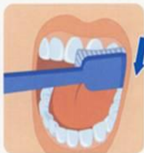
1. Наружные поверхности зубов