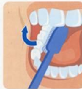
2. Внутренние поверхности зубов