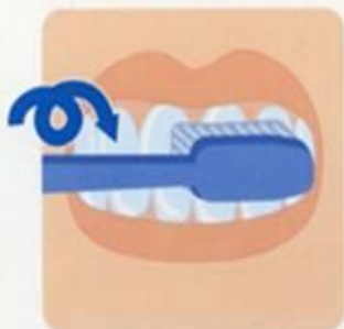
5. Массаж десен