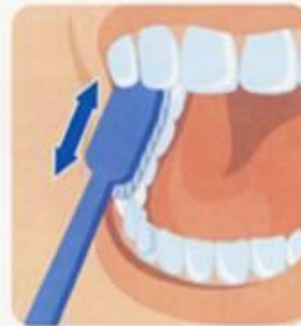
4. Жевательная поверхность зубов