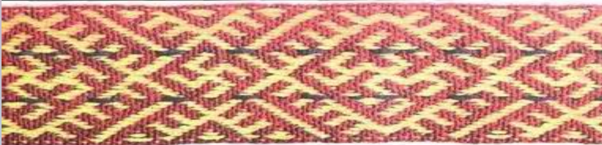
Пояс Славян Беловодья. Омская губ. XIX вв.