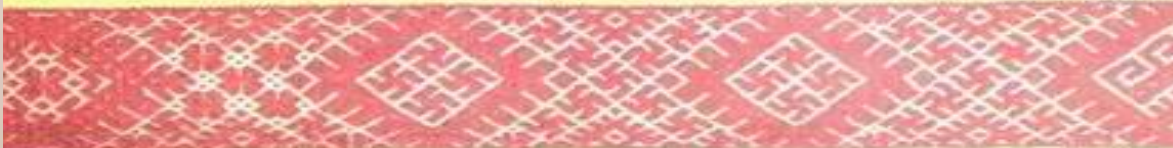
Пояс Приуральских Славян. Пермская губ. XIX в.