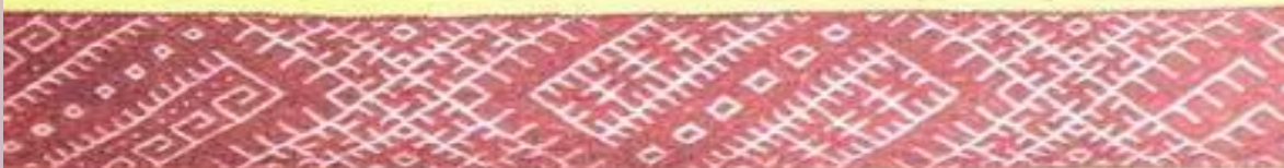
Пояс Славян Лукоморья. Тобольская губ. XVIII в.