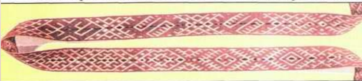
Узоротканый Марийский пояс. Марий-Эл, нач. XIX в.