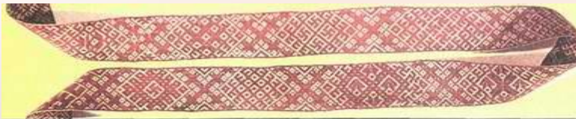
Пояс Прибалтийских Славян. Латвия, сер. XIX в.