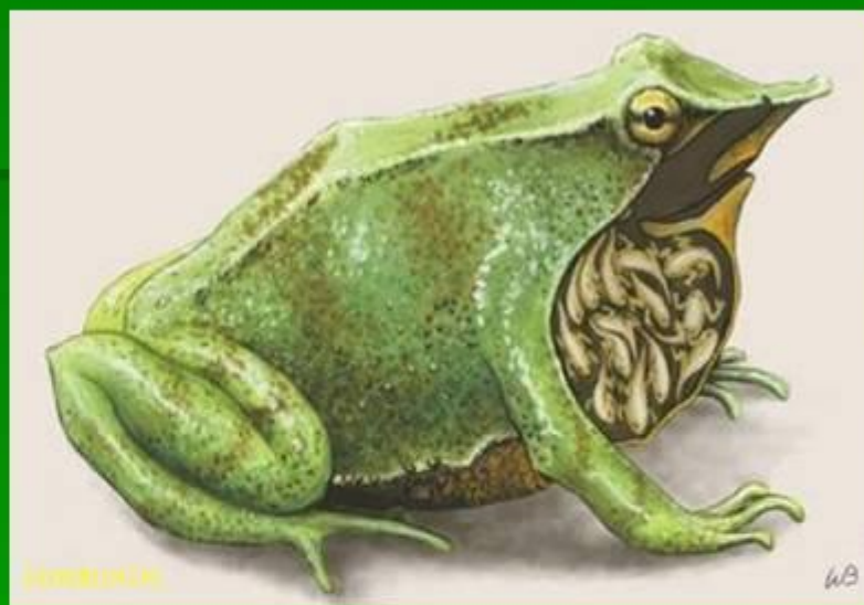
самец лягушки ринодермы