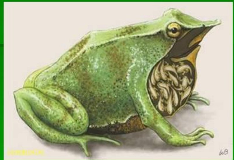
самец лягушки ринодермы