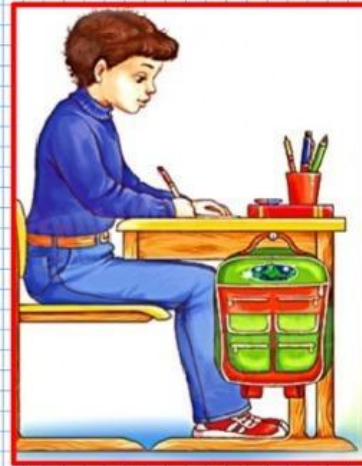
Правильная посадка при письме