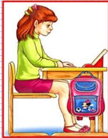
Правильная посадка при чтении