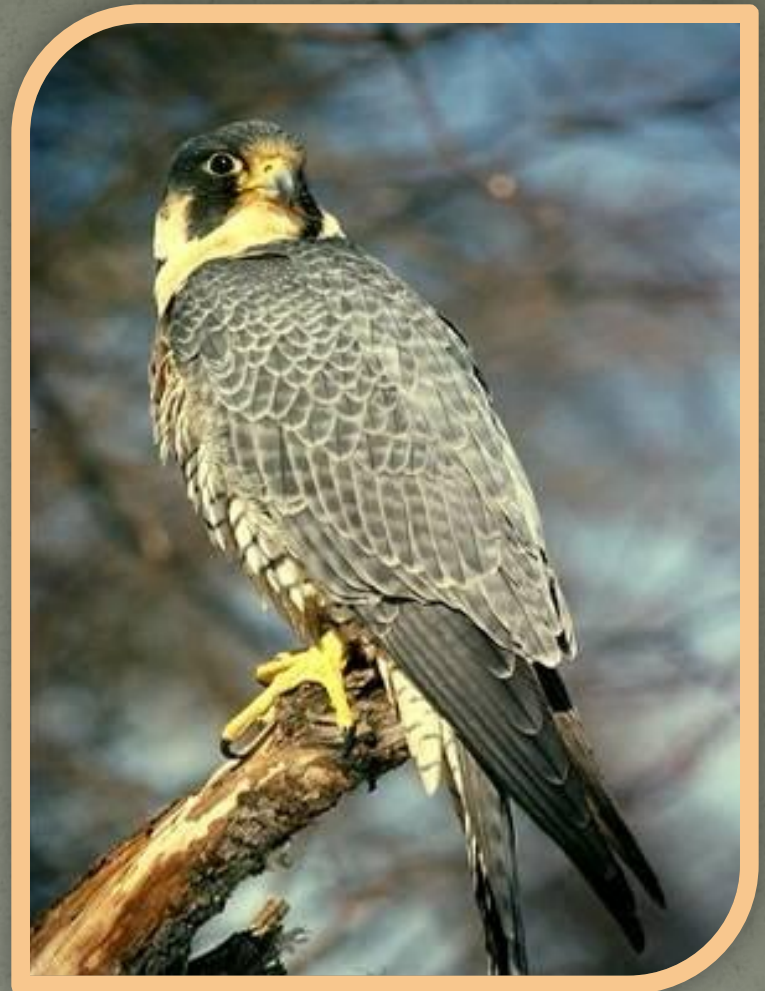
Сокол - сапсан