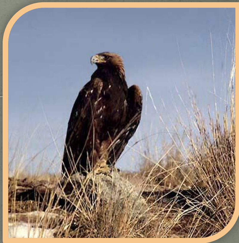
Орел - беркут