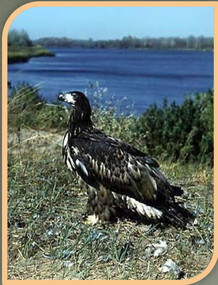
Орлан - белохвост