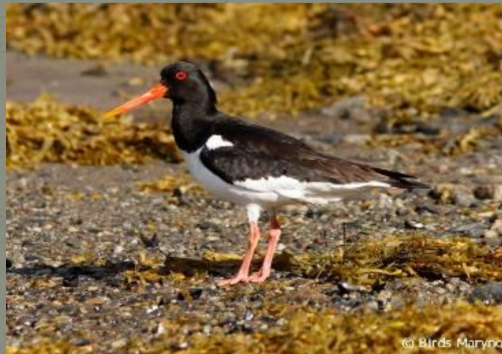
Кулик - сорока