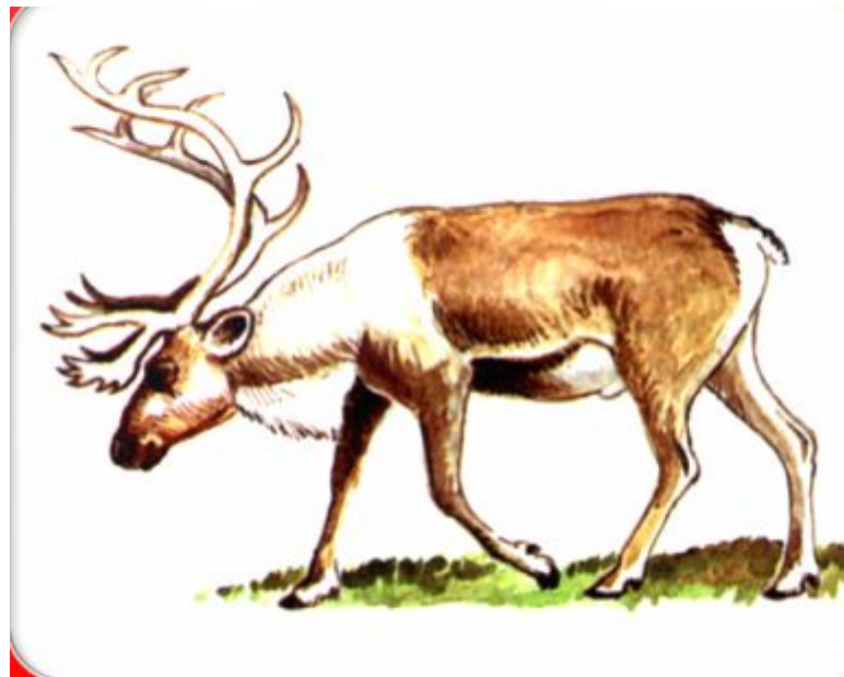
Северный олень (лесной вид)