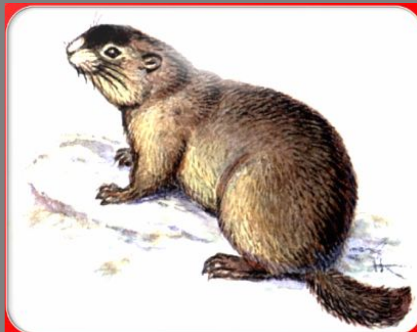
Прибайкальский черношапочный сурок