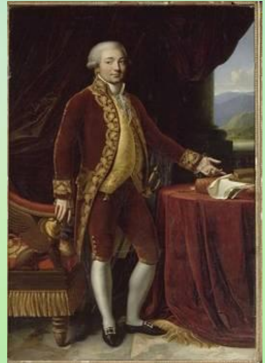
отец - Карло Буонапарте