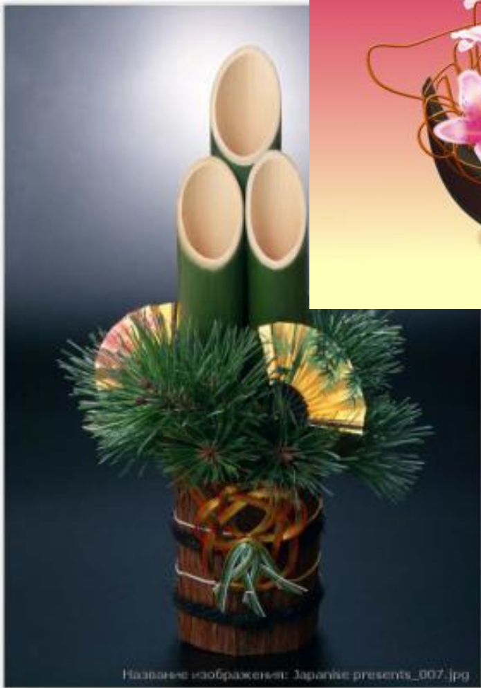
Название изображения: Zapanke presents_007.jpg