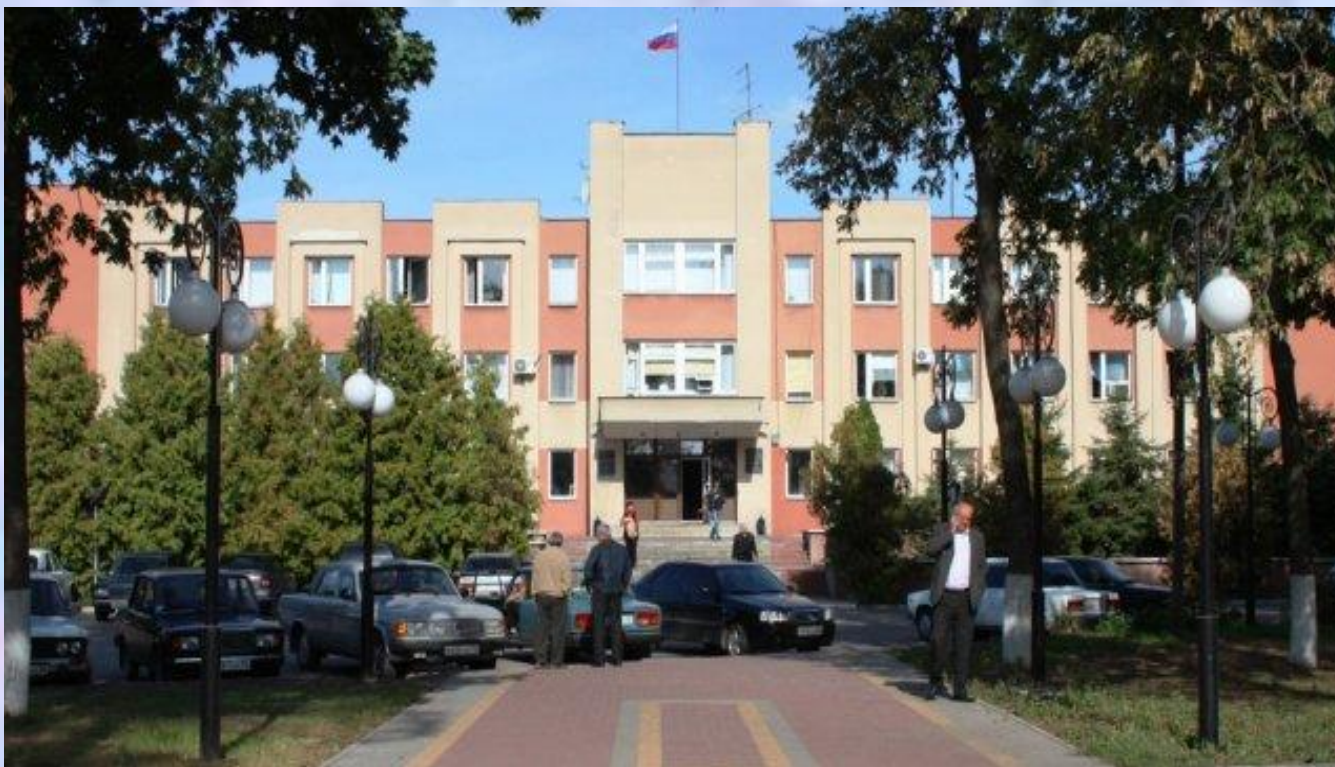
Здание районной администрации