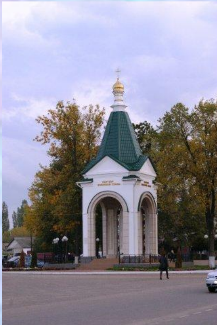
Пантеон воинской славы