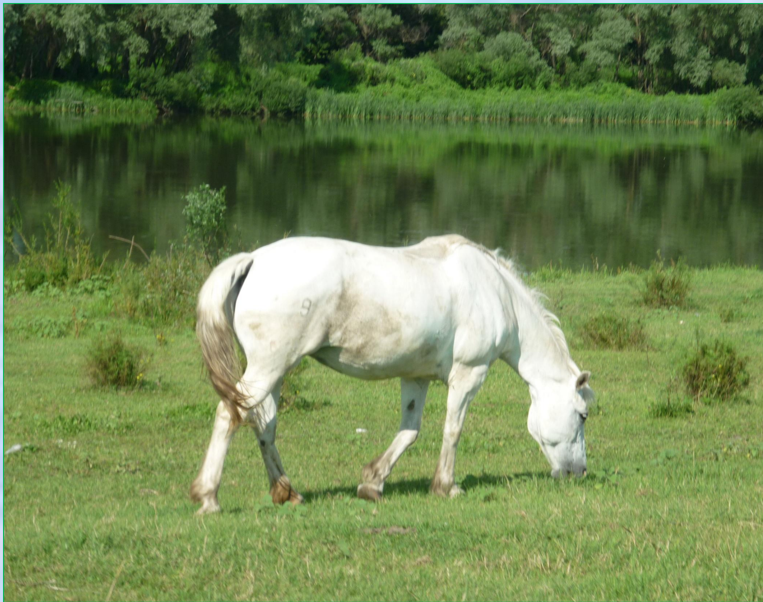
На берегу реки Усманки