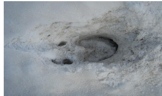
ЛОСИНЫ Й (след)