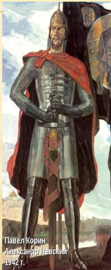
Павел Корин Александр Невский 1942 г.

Победителем телевизионного проекта "Имя Россия" стал благоверный Александр Невский - древнерусский князь и полководец. Он набрал наибольшее количество голосов (более 520 тыс.) и по результатам конкурса объявлен личностью нации.