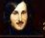
Татьяна Николаевна 1894 - 1978 Исторический персонаж

500 исторических личностей 76809 проголосовавших 29 дней до выбора 12 финалистов