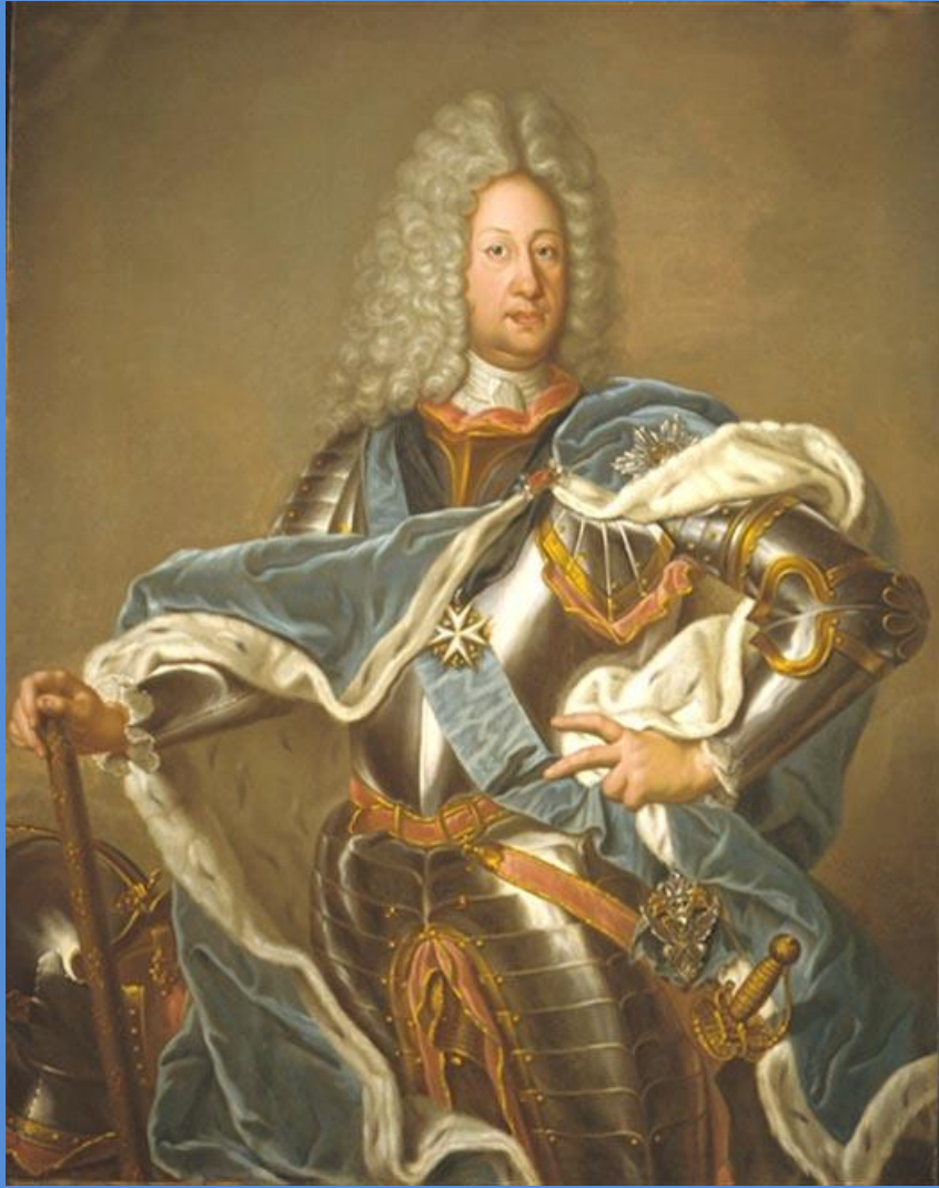
Граф Шереметев Борис Петрович