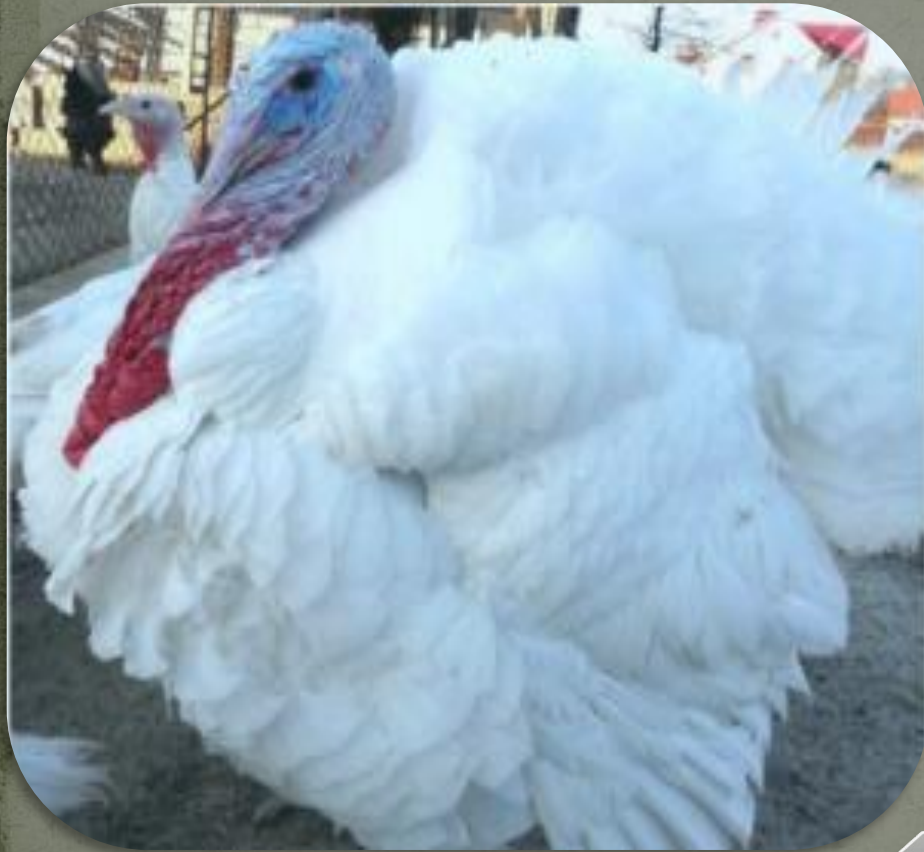
Белый широкогрудый индюк

Индейка — самая крупная сельскохозяйственная птица. Индюки крупных широкогрудых пород достигают массы 20 кг.