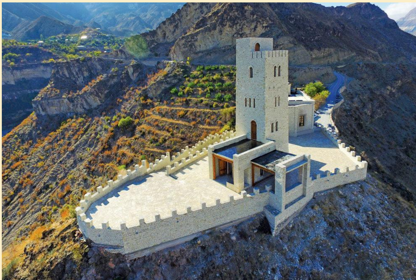
Мемориальный комплекс «Музей общей памяти» с. Ашильта.