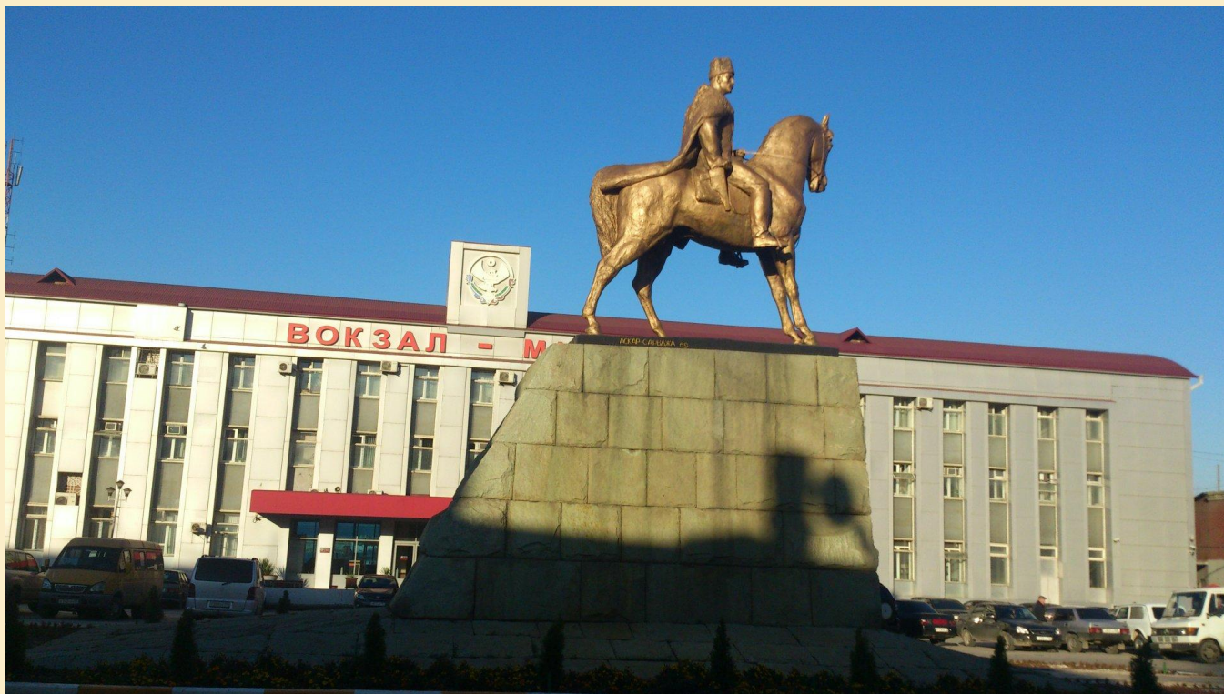
Памятник революционеру Махачу Дахадаеву.