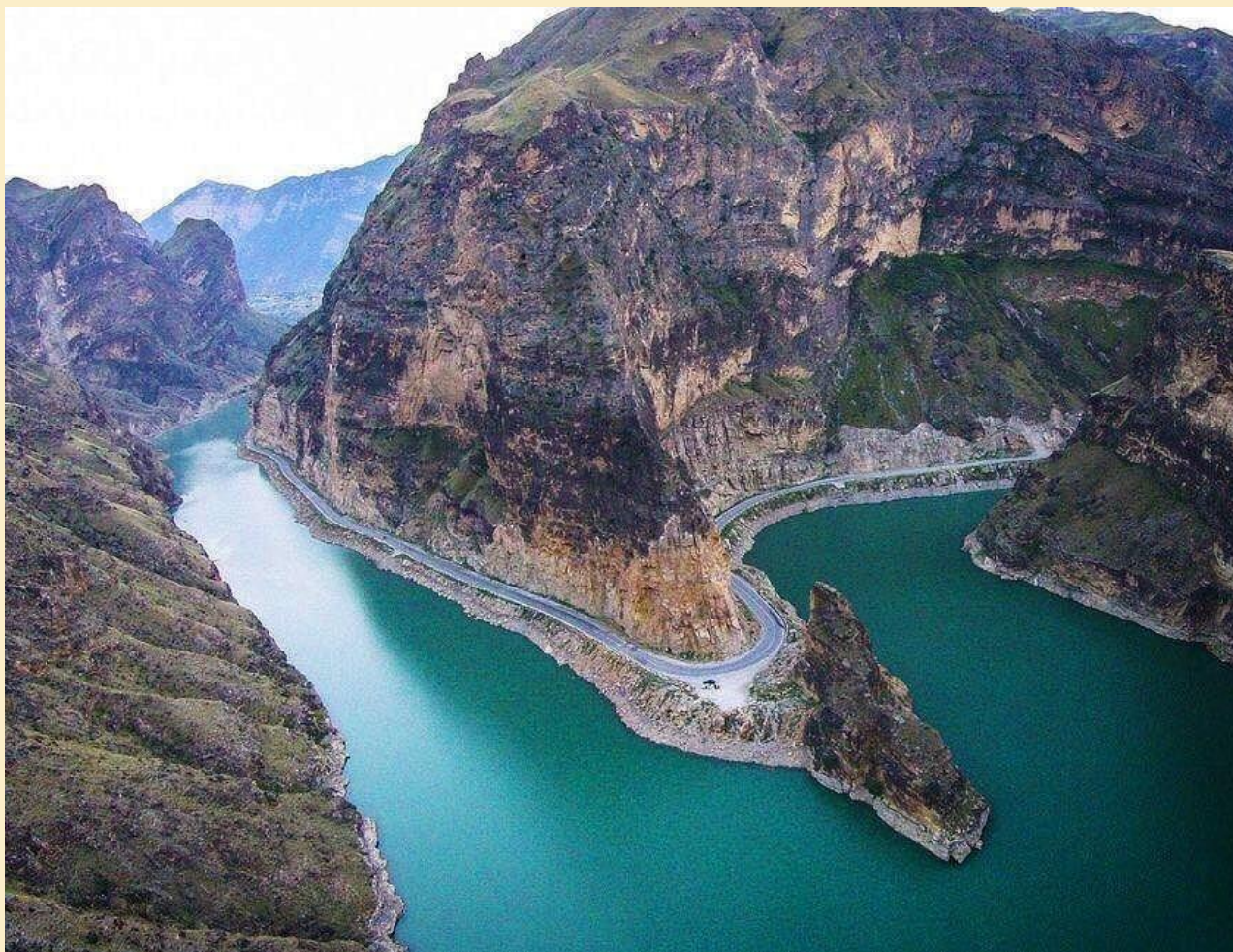
Начало реки Сулак