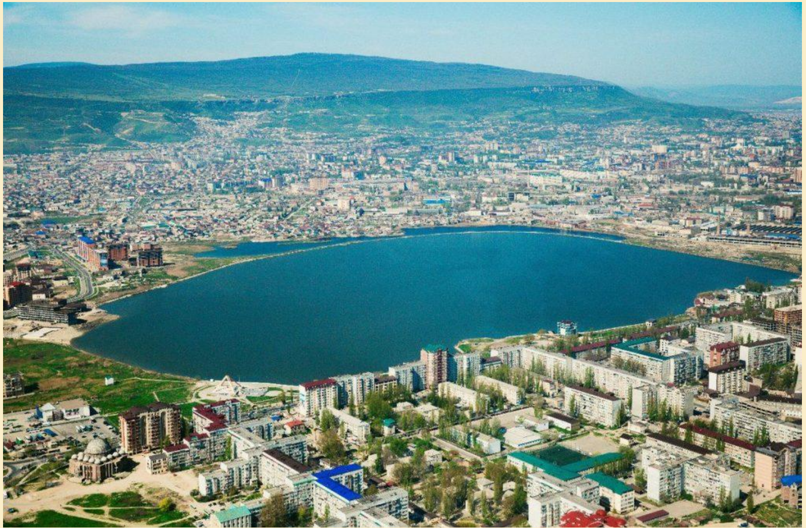
Озеро Ак гелъ Махачкала