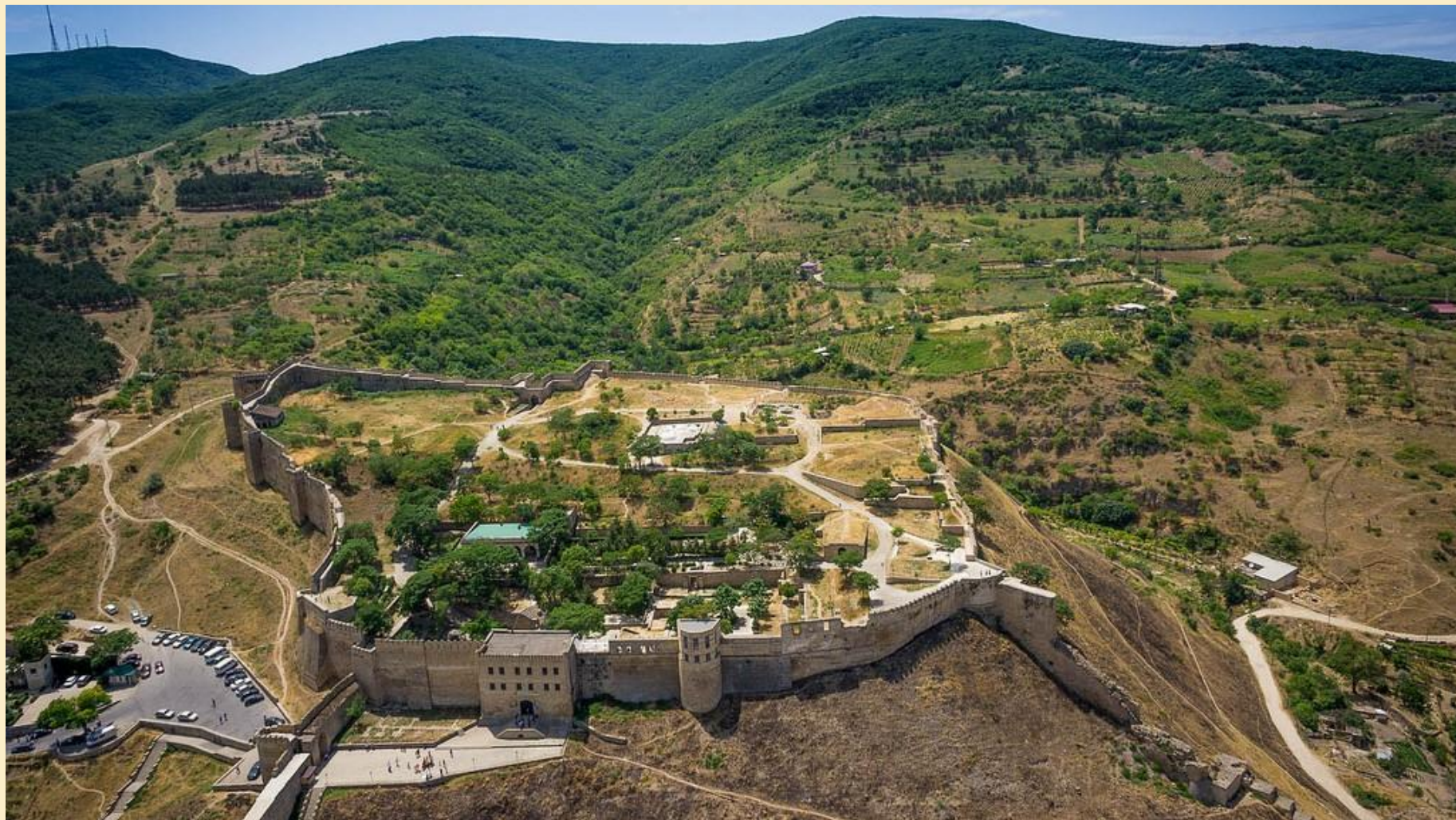
Крепость Нарын-кала Дербент.