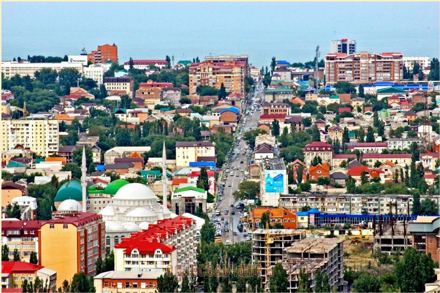
Махачкала – столица Дагестана.