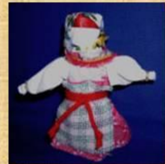
Владимирская столбушка на бересте

Девка – Баба кукла – перевёртыш, содержащая в себе 2 разных образа)