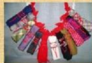
Лихорадки. От болезней, раньше были в каждом доме, размером с ладошку – каждая. Всего 12 шт.