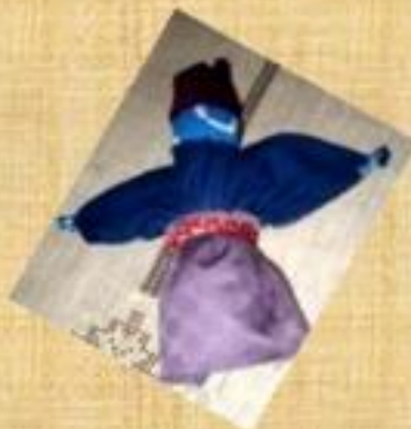
Берегиня сна - охраняет сон, для детей и взрослых.