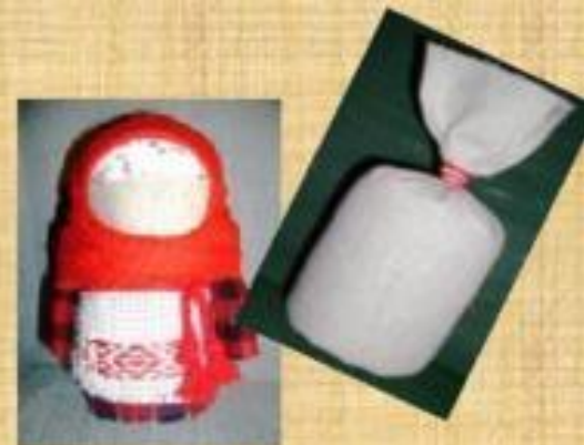
Зернушки или Крупенички- оберег на сытость и достаток в доме

Наши предки считали, чем искуснее сделан оберег, тем большей силой он обладает