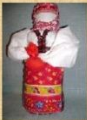
Кукла Берегиня дома