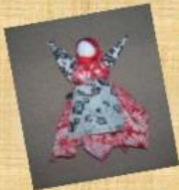
Платочница-оберег женского здоровья

Наши предки считали, чем искуснее сделан оберег, тем большей силой он обладает