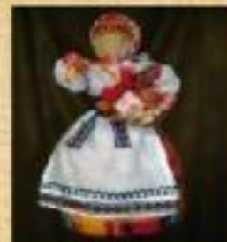
Параскева- Пятница- покровительни ца рукоделия