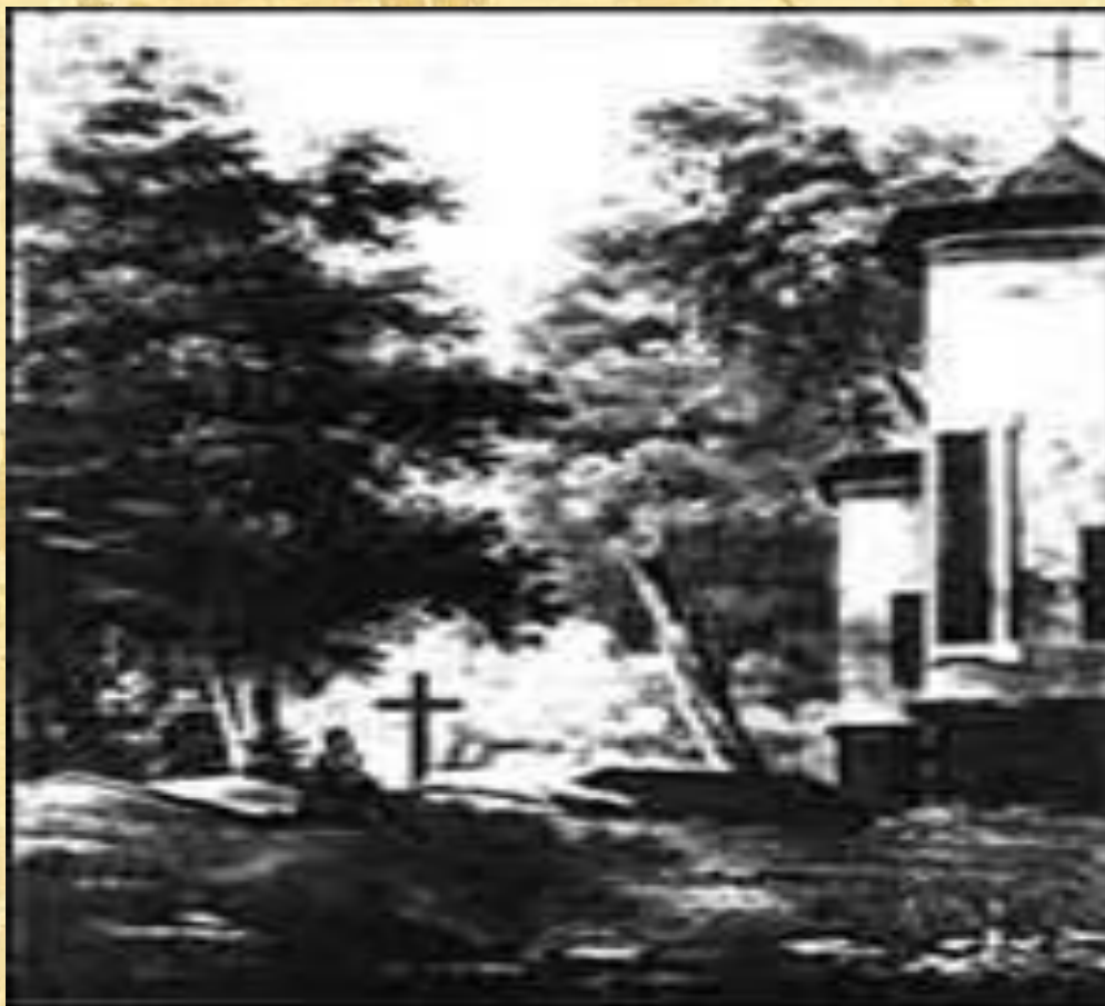
Могила Александра Сергеевича Пушкина

Прожив 2 дня в страшных мучениях, Пушкин скончался 10 февраля 1837 г.