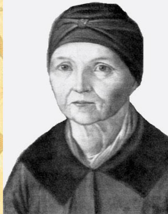
Яковлева Арина Родионовна

Любовь к родному языку маленькому Пушкину привили бабушка, Мария Алексеевна Ганнибал, превосходно говорившая и писавшая по-русски, и няня Арина Родионовна.