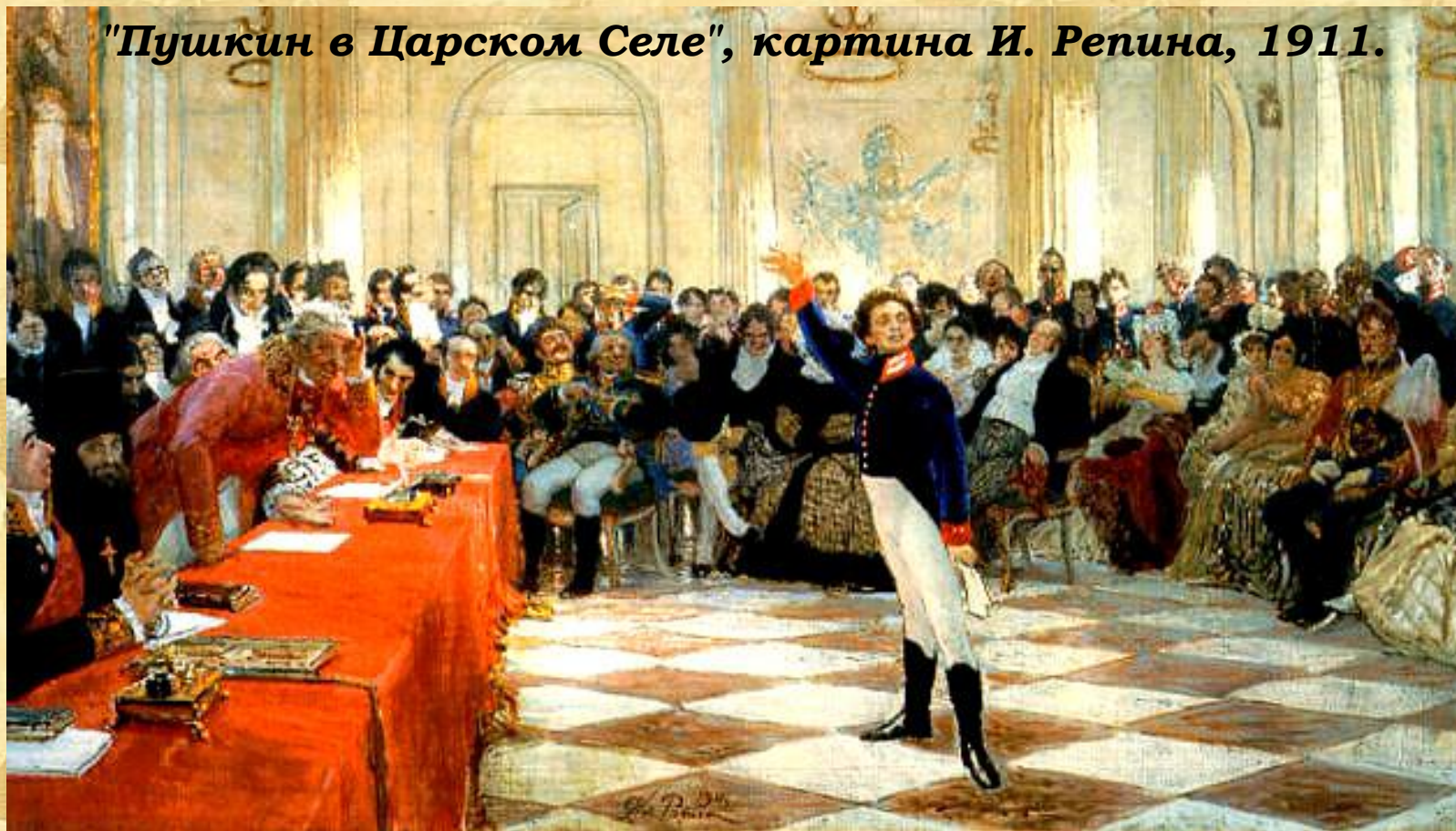
"Пушкин в Царском Селе", картина И. Репина, 1911.

В 1815 г. Пушкин с триумфом прочел на экзамене свое стихотворение "Воспоминание в Царском Селе" в присутствии знаменитого поэта Г.Р.Державина. Срок пребывания в лицее кончился летом 1817 года. 9 июня состоялись выпускные экзамены.