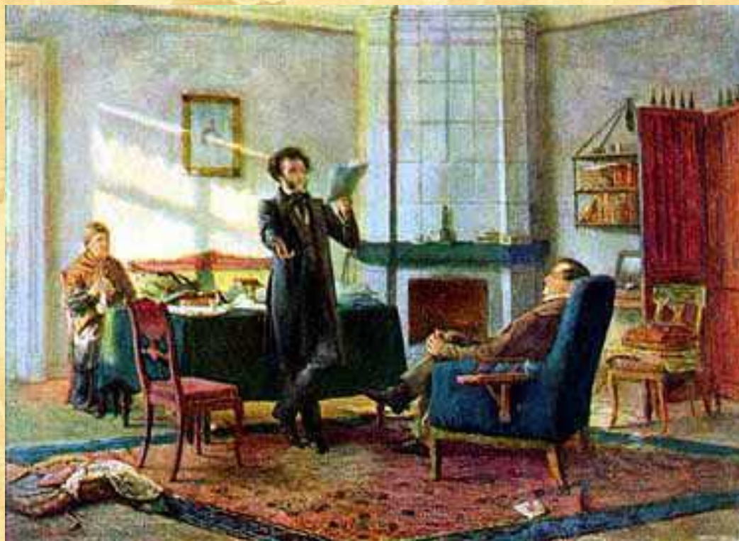
Пушкин в селе Михайловском (Пушкин у Пушкина). Н.Н. Ге. 1875 г.

За три года ссылки написаны "Кавказский пленник", "Бахчисарайский фонтан", а также "Узник", "Песнь о Вещем Олеге". Начат роман в стихах "Евгений Онегин".