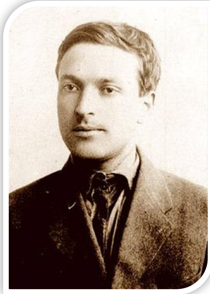
Лев Семенович Выготский (1896-1934)