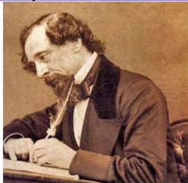
Чарльз Диккенс (07.02.1812 – 09.06.1870)