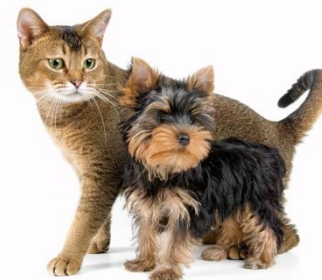
Кошки и собаки