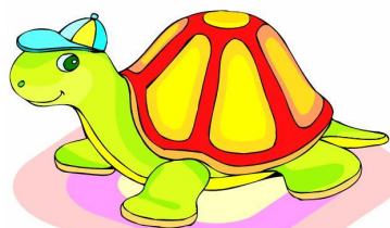
Земноводные и пресмыкающиеся