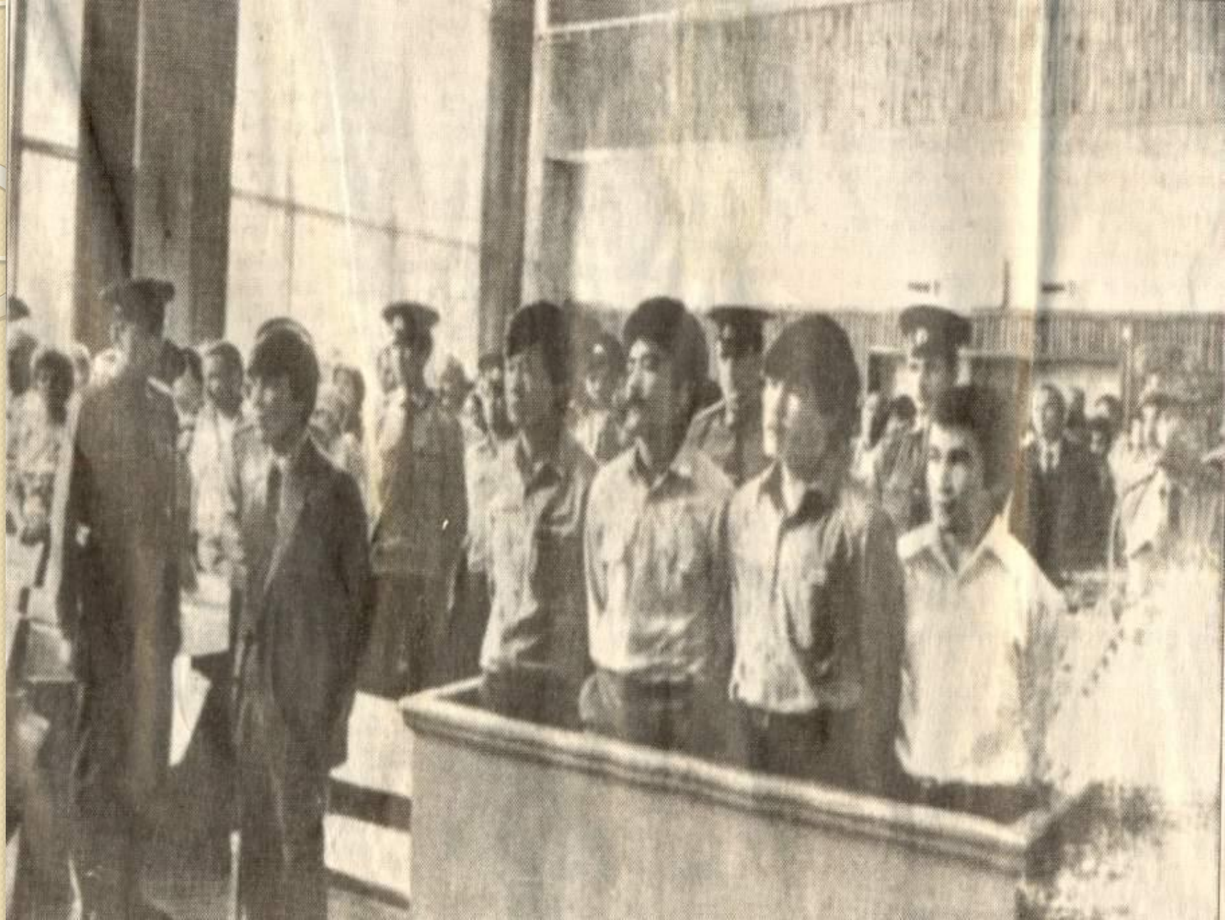
Желтоқсан қаһармандарына болған сот орнынан көрініс